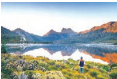
■冬日的塔斯曼尼亞(圖片來自塔斯曼尼亞旅遊局)又或是品嚐美酒佳餚,塔斯曼尼亞都絕對能滿足旅客所有願望。

冬日的塔斯曼尼亞(圖片來自塔斯曼尼亞旅遊局)又或是品嚐美酒佳餚,塔斯曼尼亞都絕對能滿足旅客所有願望。