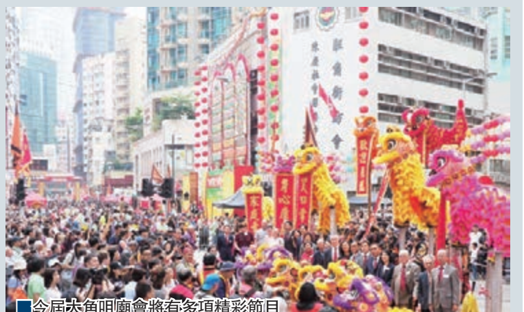
■今屆大角咀廟會將有多項精彩節目

攝影比賽,吸引廣大市民及攝影愛好者,將廟會的歡樂時刻永恆留住。大角咀廟會歷年來,均盡量使用可重用的物資,包括場地佈置的燈籠,指示橫額、國旗區旗,巡遊隊牌及物資、義工制服及特色衣服,飄色車等,今屆廟會晚上舉辦千人盆菜宴,將筵開150席,大會繼續棄用即棄餐具,不提供枝裝水、汽水及濕紙巾,不用膠枱布,鼓勵大家自備餐具,剩餘的盆菜,可自備餐盒帶走,減少廚餘,工作人員及義工,大會將不會提供即棄飯盒,並藉此活動,吸引外地遊客和本港人士,共同推動環保意念,為環保出一分力。大角咀廟會是一個非常多元化的平台,大會除透過表演節目外,亦設置不同的攤位活動,讓大家進行親子活動,種族共融的機會,也弘揚中國傳統文化和藝術交流,今年大會繼續撥出30個創業攤位,免費讓社區人士及青少年、待業人士售賣創意及特色的物品,鼓勵他們發展所長,積極進取,逆境自強。