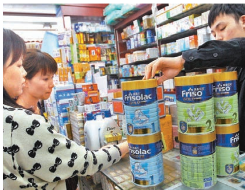
食衛局表示,維持「限奶令」決定是政府經過市場調查,並參考相關各方意見後作出的決定。圖為早內地客來港選購奶粉的情況。

他指出,現時本港奶粉商有85%配方粉均為出口,只有15%留港供應,顯示貨量非常充足,完全沒有需要維持「限奶令」。他又認為,即使不完全取消限制,亦可考慮逐步放寬,例如將攜帶兩罐奶粉出境的上限提升至4罐。