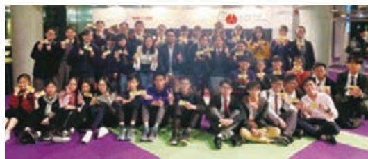
■第47屆香港藝術節呈獻瑞士默劇團《百變樂團》演出,2月21日演出贊助機構諾亞控股邀請40名本地學生一同觀賞,並合照留念。

1972年成立的瑞士默劇團一直以簡單的材料在舞台上為世界各地的朋友帶來豐富的想像力和歡笑。沒有天馬行空的佈景,沒有高科技建構的舞台下,瑞士默劇團四十多年來以日常生活中的物件及廢物循環利用,製作服裝、道具及造型,結合舞蹈、形體及光影,扮演舞台上不同的物件如家庭電器、浴室用品、樂器,甚至小動物。讓舞台前的大小朋友在觀賞時也能擁有無限的想像空間,在這默劇中啟發獨特的奇思妙想。適合任何年齡、任何背景觀眾的《百變樂團》是一個為小朋友發展創意及想像力的默劇表演節目,更是一個為童心未泯的大朋友尋找歡笑的精彩旅程。