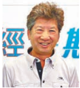
湯家驊表示,修例只為彰顯社會公義。

香港文匯報訊(記者何西)反對派一直陰謀論稱,特區政府會藉修訂《逃犯條例》和《刑事事宜相互法律協助條例》,向內地移交「政治犯」云云,而大力阻撓有關修例建議。行政會議成員湯家驊昨日強調,與國際間有移交逃犯的安排,以處理嚴重罪行,純粹為彰顯社會公義,法治社會中無人可凌駕法律,而任何一個現代社會都不應成為「逃犯天堂」,有關安排與政治無關。他並批評,一些知名法律界人士和立法會議員明知有關事實,卻仍作出這些毫無事實根據的指控,行為卑劣。