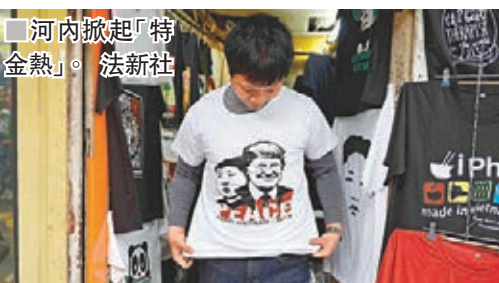
河內掀起「特金熱」。法新社