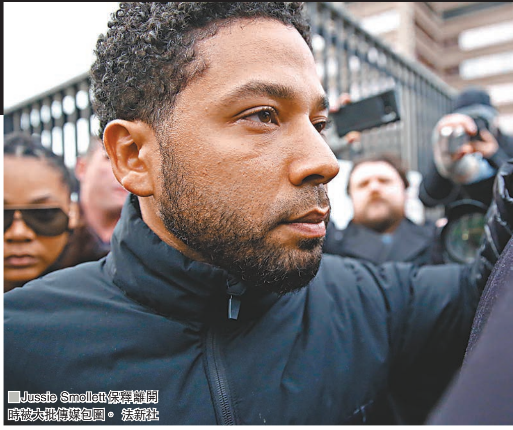
Jussie Smollett保釋離開時被大批傳媒包圍。