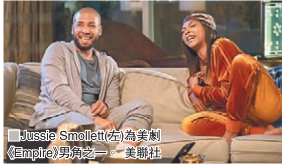
Jussie Smollett(左)為美劇《Empire》男角之一。

2月20日：Jussie Smollett被起訴報假案，他其後自首。芝加哥警察局長約翰遜翌日召開記者會，指控Jussie Smollett為求催谷人氣和加薪，自編自導自演襲擊事件。