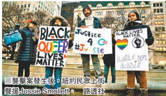
襲擊案發生後，紐約民眾上街聲援Jussie Smollett。