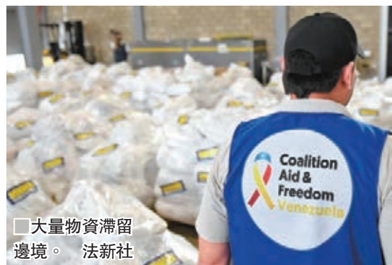
大量物資滯留邊境。