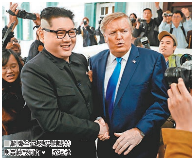
翻版金正恩及翻版特朗普轉戰河內。