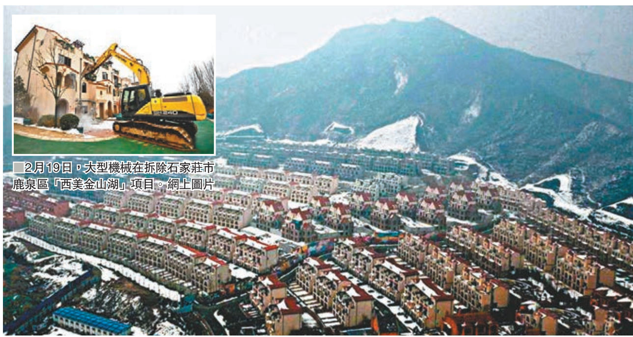
「西美金山湖」項目目前共建成160餘棟低層建築，含1棟獨棟住宅，其中19畝非法佔地上的建築已陸續拆除。

記者採訪了解到，自2013年5月9日至事發生前的2019年2月10日，鹿泉區國土、規劃、住建、綜合執法等部門針對「西美金山湖」項目違法建設和違規銷售行為，進行