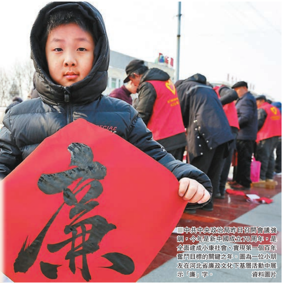
■中共中央政治局昨日召開會議強調，今年是新中國成立70周年，是全面建成小康社會、實現第一個百年奮鬥目標的關鍵之年。圖為一位小朋友在河北省廉政文化下基層活動中展示「廉」字。資料圖片