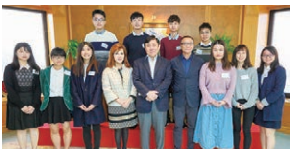
新地主席兼董事總經理郭炳聯(前排中)嘉許獲獎學金的員工子女，並寄語他們努力學習之餘要注意身心健康。動，更鼓勵大家參加由集團舉辦的「新地公益垂直跑一勇闖香港ICC」活動。

日前，新地主席兼董事總經理郭炳聯親自嘉許各同學，並分享學習點滴和人生經驗。他希望獎學金能減輕基層員工的財務負擔，讓員工安心和長期為集團服務，而員工子女亦能把握大學校園良好的環境，努力學習。他寄語一眾學子多參與課外活動，擴闊視野，並嘗試投入義務工作，關懷弱勢。此外，他提醒年輕人在求學之餘亦要保持身體健康，多做運動及參加有益身心的活