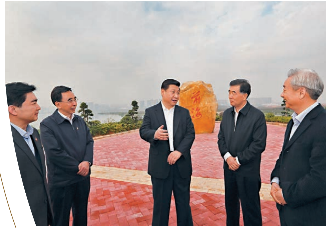
2012年12月，習近平總書記在黨的十八大後首次離京考察就來到廣東。這是習近平在深圳前海深港現代服務業合作區考察。