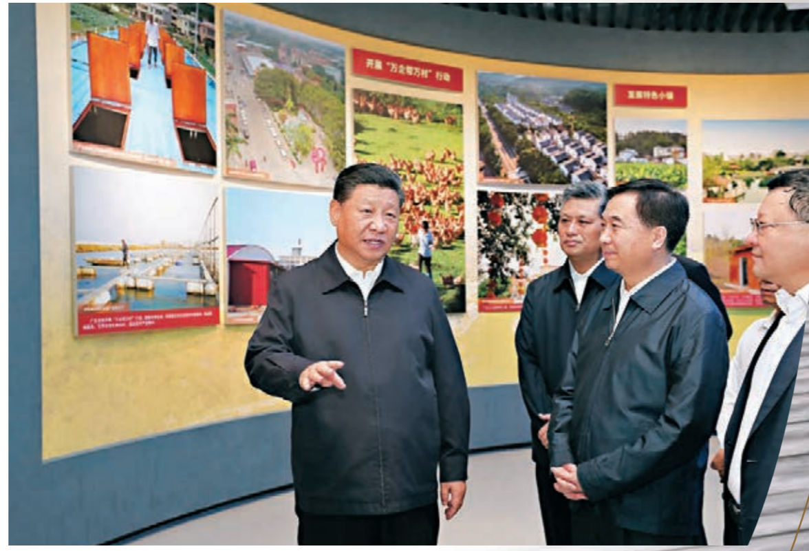
2018年10月，習近平總書記再次來到廣東。這是習近平在深圳改革開放展覽館參觀「大潮起珠江——廣東改革開放40周年展覽」。