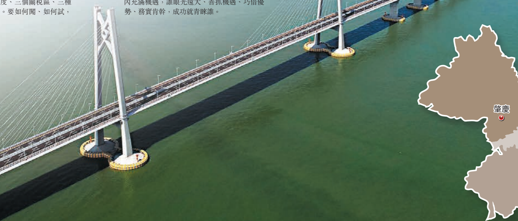
伶仃洋海天一色，港珠澳大橋飛架三地。