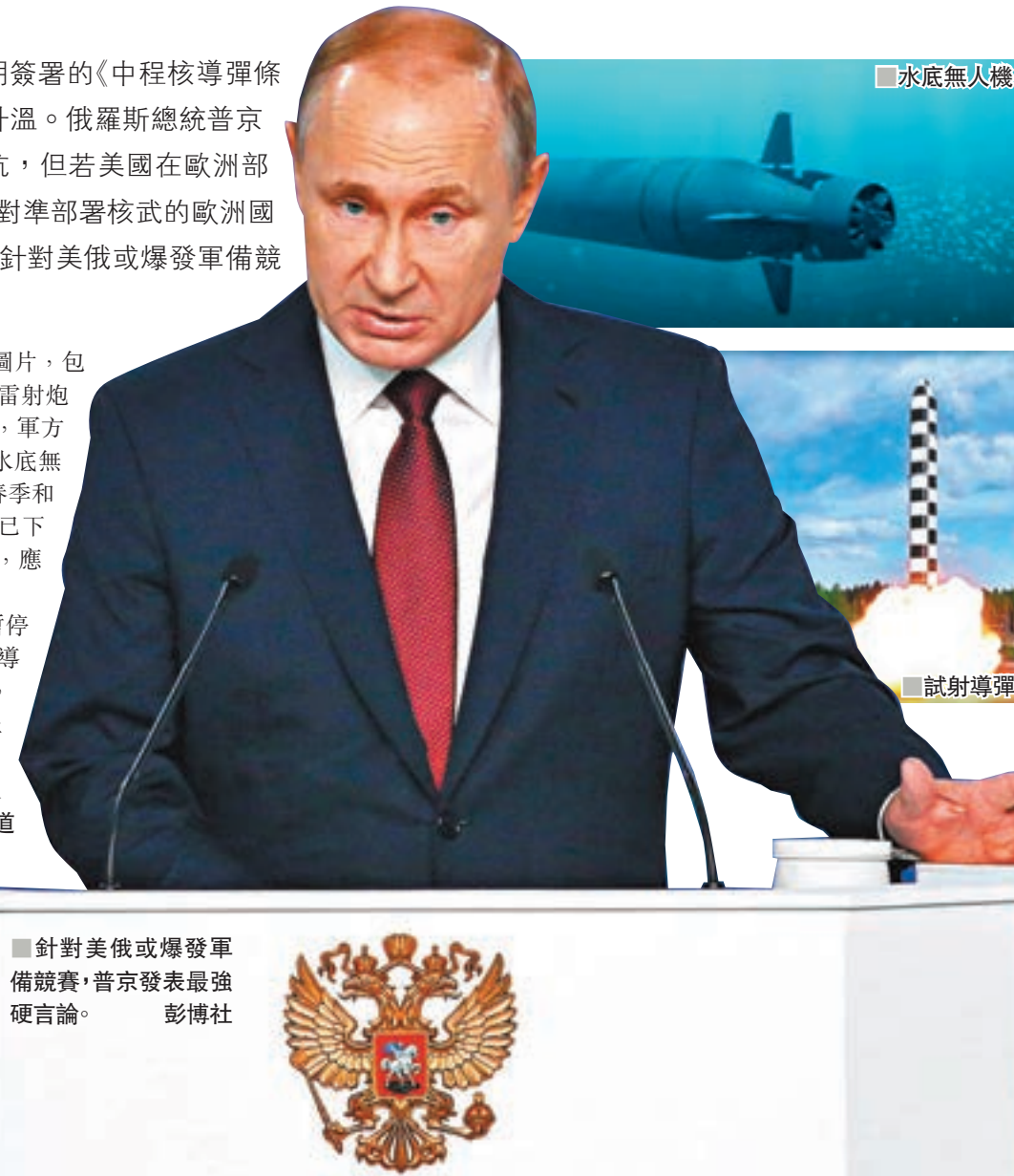
針對美俄或爆發軍備競賽，普京發表最強硬言論。