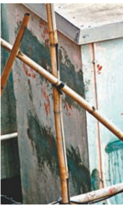
探員在天台發現疑似血掌印，但經檢驗相信只是紅色油漆。

探員初步調查，翻查大廈閉路電視片段未有發現涉案疑人，天台血掌印亦相信只是油漆，但未知死者身上傷痕屬自殘或遇襲造成，列作「送院時死亡」案處理，死因有待法醫驗屍確定。