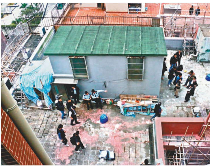
大批探員封鎖天台進行調查。