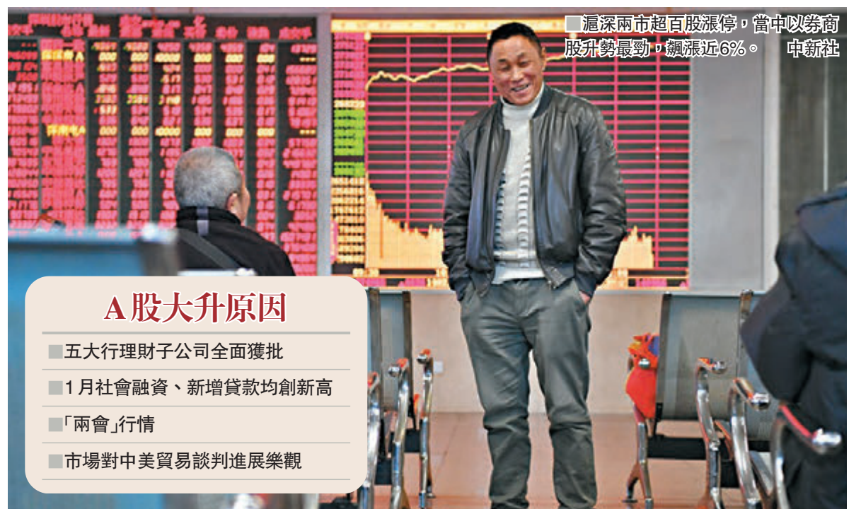
滬深兩市超百股漲停,當中以券商股升勢最勁,續漲近6%。中新社

科创板也在加緊推進,據《中國證券報》報道,15日到17日,上交所黨委書記、理事長黃紅元及所領導班子成員先後分赴上海、北京、深圳及成都四地召開9場座談會,面對面聽取市場各類主體對設立科创板並試點註冊制配套規則的意見建議。全國113家證券公司、13家基金管理公司、24家代表性創投機構、5家保險資管企業、6家律師事務所和4家會計師事務所的主要負責人以及部分個人投資者代表參加座談。