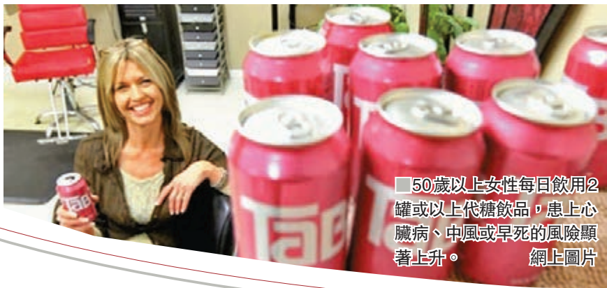
50歲以上女性每日飲用2罐或以上代糖飲品，患上心臟病、中風或早死的風險顯著上升。

美國心臟協會及美國中風協會上週四發表研究報告，顯示50歲以上的女性每日飲用2罐或以上代糖飲品，患上心臟病、中風或早死的風險顯著上升。領導研究的紐約愛因斯坦醫學院助理教授拉赫馬尼表示，許多肥胖人士選擇飲用無糖飲品，但事實上當中所含的代糖會損害健康，經常飲用會增加患上中風和心臟病的機會。 研究團隊於1990年代中開始，收集美國逾8萬名50至79歲婦女的數據，詢問她們過往3個月飲用12安士代糖飲品的