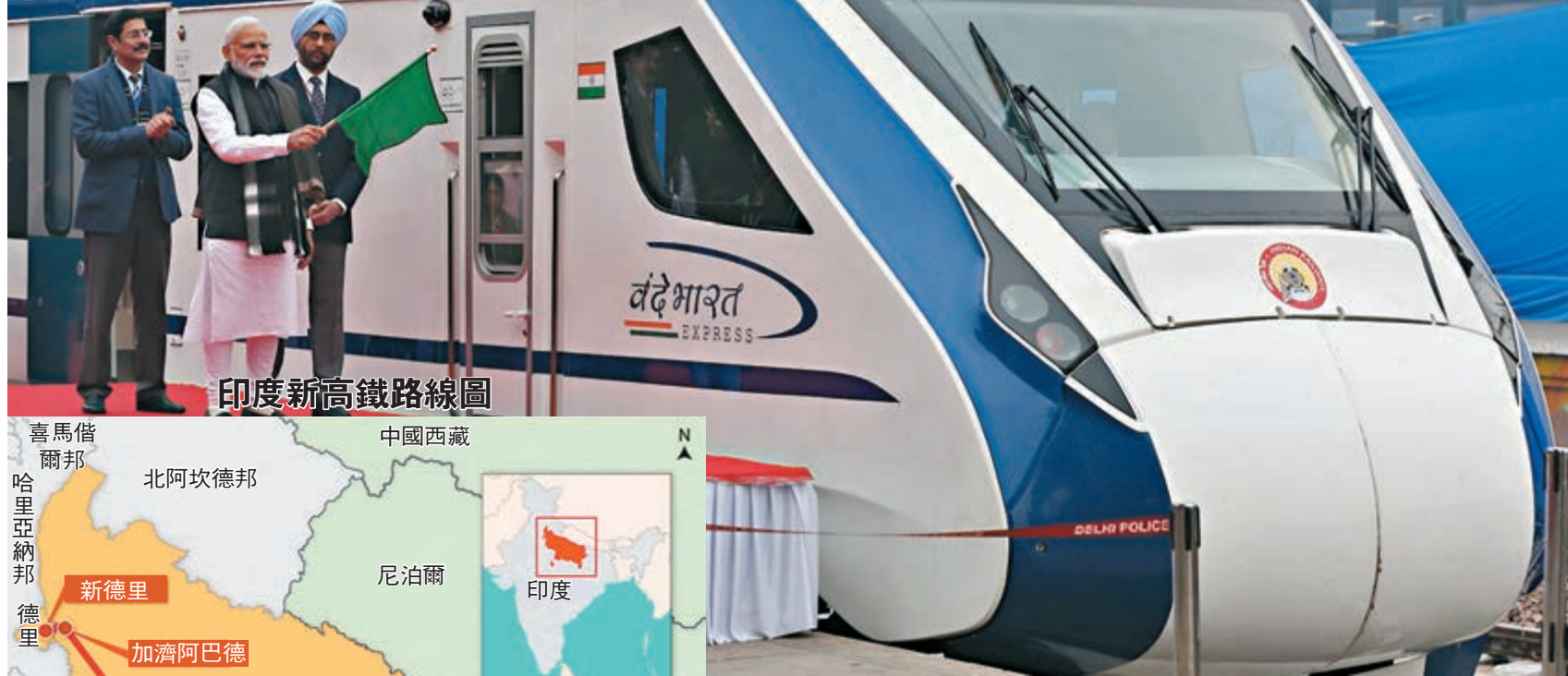
印度新高鐵路線圖