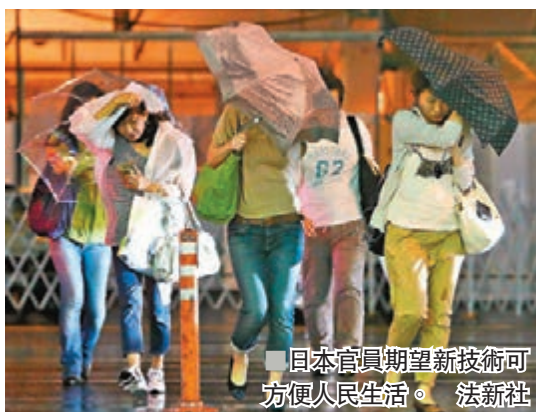
日本官員期望新技術可方便人民生活。