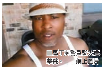
馬丁與警員交火遭擊斃。