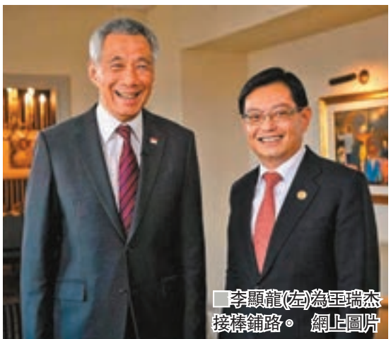
李顯龍(左)為王瑞杰接棒鋪路。