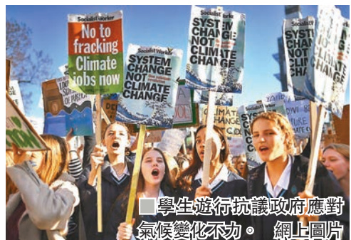
學生遊行抗議政府應對氣候變化不力。