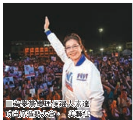
為泰黨總理候選人素達叻出席造勢大會。