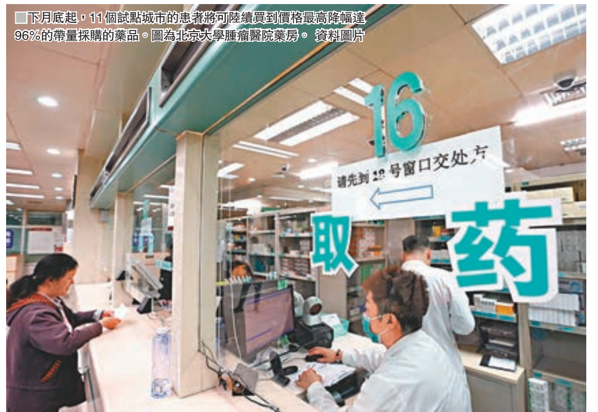
下月底起，11個試點城市的患者將可陸續買到價格最高降幅達96%的帶量採購的藥品。圖為北京大學腫瘤醫院藥房。資料圖片

此外，對於專利已過期的原研藥，如果通過帶量採購把藥價降下來，也可節省醫保基金的支出，使創新藥得到醫保基金的支持。