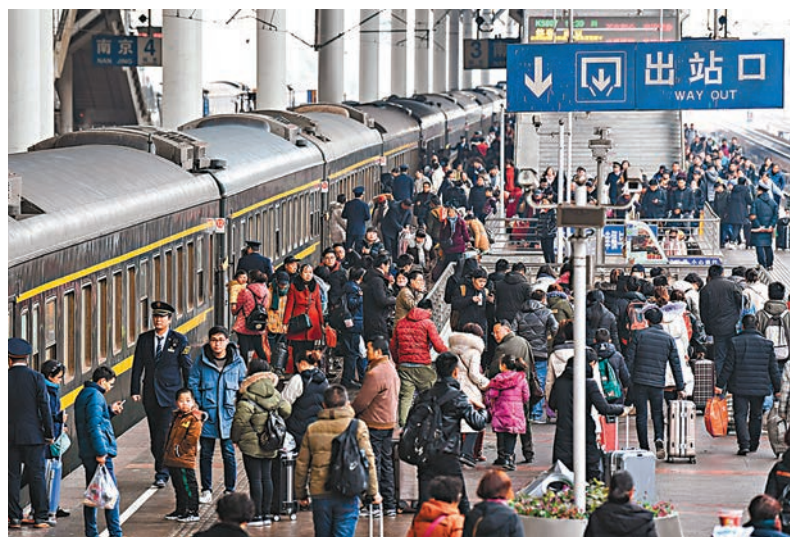
春運熱潮仍在全國各地鐵路持續。圖為本月13日，旅客在江蘇南京站進站乘車。新華社

南昌局南昌、景德鎮北等站深入推進「廁所革命」，改善候車室廁所、電茶爐、候車椅和照明等設施，讓候車環境更加舒適；廣州局深圳站「迎春花」服務隊聯合地鐵及公交等單位，推出「愛心接力圈」服務，為旅客出行提供便利；南寧局柳州站「劉三姐」映梅服務台提供出行諮詢、失物招領及應急改簽等服務。