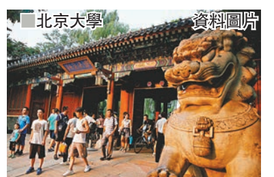
北京大學 資料圖片 香港文匯報訊 據中社報道，北京大學昨日發佈關於招聘中國內地男演員翟天臨為博士後的調查說明，認定翟天臨存在學術不端行為，並同意該校光華管理學院13日對其作出的退出博士後科研流動站決定。

北大表示，經調查發現，在翟天臨進站材料審核、面試和錄用過程中，合作導師、面試小組和光華管理學院存在學術把關不嚴、實質性審核不足的問題。因此，學校決定對該合作導師作出停止招聘博士後的處理，對面試小組成員給予嚴肅批評，責成光華管理學院作深刻檢查。