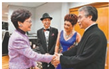
林鄭月娥捧場欣賞葉麗儀、葉振棠演出。

今次活動亦能感受到當地的獨特文化,更指能夠與少數民族一起互動令他感到興奮,有意日後到當地旅遊。 來自山東的邱小姐則表示,對於能夠在港體驗貴州文化感到非常驚喜,並大讚活動通過人文山水去展示當地民族風情的形式是特別的好,可讓香港市民更容易體會中華傳統文化,從而拉近兩地人民的距離。