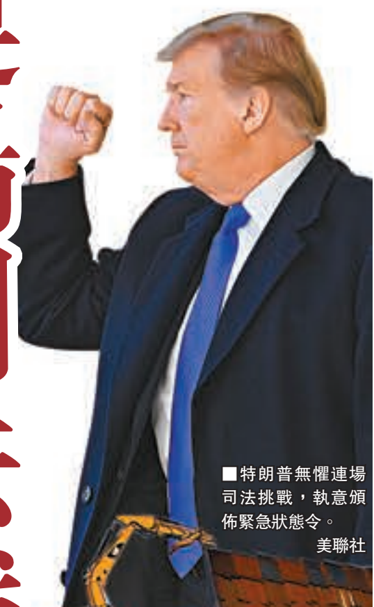
■特朗普無懼連場司法挑戰，執意頒佈緊急狀態令。