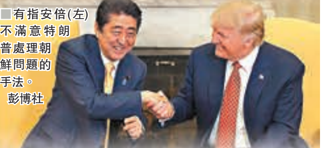
■有指安倍(左)不滿意特朗普處理朝鮮問題的手法。彭博社

另據美國有線新聞網絡(CNN)前日報道，米勒團隊的調查人員，已向白宫發言人桑德斯問話。桑德斯曾於2016年擔任特朗普競選團隊顧問，她前日表示會全面與檢方合作。 ■美聯社路透社法新社