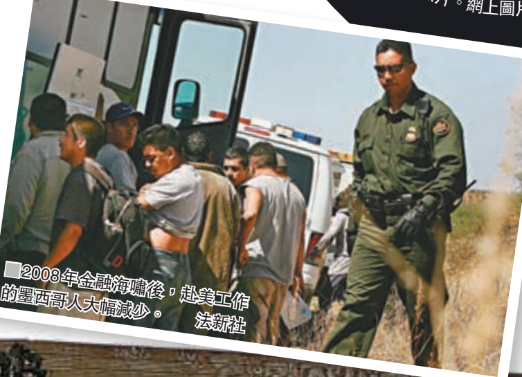
2008年金融海嘯後，赴美工作的墨西哥人大幅減少。

此外，墨西哥自1973年起提倡控制人口，令墨國人口增長放緩，間接減少墨西哥人移居美國的人數，加上墨西哥販毒集團肆虐邊境，許多墨西哥人為安全起見，不再冒險跨境。米尼安指出，美國向墨西哥出售大量軍火，加劇墨國幫派暴力，若美國減少售武，有助改善當地治安，將有更多人願意留下。 ■綜合報道