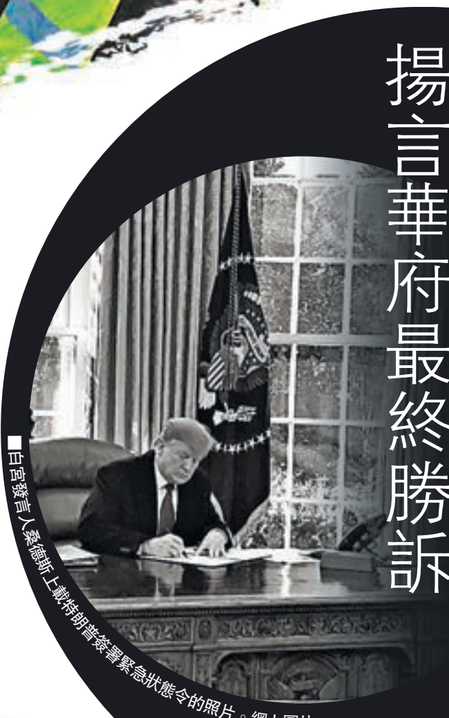
白宫發言人桑德斯上載特朗普簽署緊急狀態令的照片。網上圖片