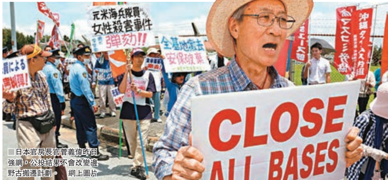
日本官房長官菅義偉昨日強調，公投結果不會改變邊野古搬遷計劃。