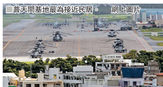
普天間基地最為接近民居。