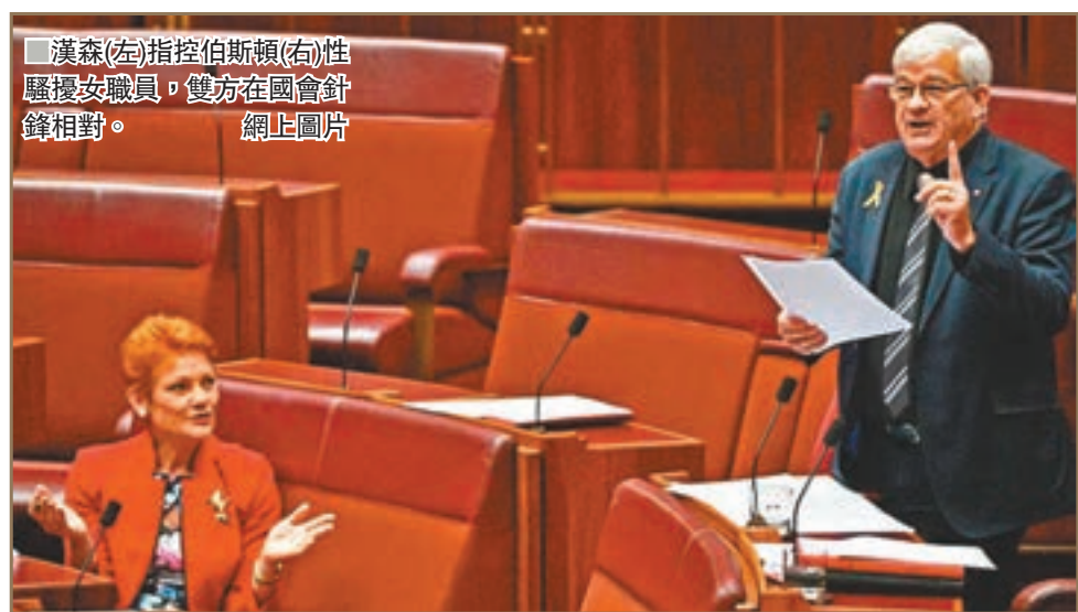
漢森(左)指控伯斯頓(右)性騷擾女職員，雙方在國會針鋒相對。

澳洲聯邦參議員伯斯頓因不滿女參議員漢森指他性騷擾女職員，前晚與漢森的首席顧問阿什比在國會大樓內爭執，雙方更大打出手，過程被鏡頭拍下。伯斯頓其後向記者展示其手指遭割傷的傷口，更承認曾把血跡抹在漢森的國會辦公室大門上。伯斯頓已就事件報警，要求向阿什比發出禁制令。