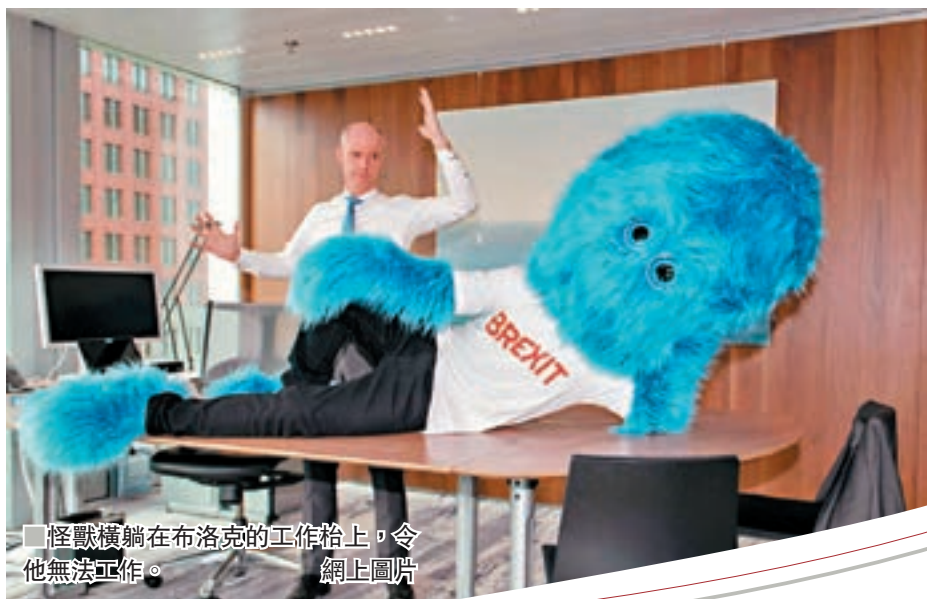
怪獸橫躺在布洛克的工作枱上，令他無法工作。