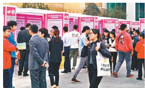
東莞春節後將陸續舉辦40場招聘會。香港文匯報東莞傳真

香港文匯報訊(記者 帥誠 東莞報道)昨日,香港文匯報記者從東莞市人社局了解到,作為「製造業名城」的東莞,春節後將陸續舉辦40場招聘會,預計將有800多家企業提供超過10萬個工作崗位。日前在東莞市職業介紹服務中心舉辦的節後首場招聘會上,近百家企業參會,其中製造業佔比達六成,普工需求普遍增加,有企業鼓勵「老鄉帶老鄉」應聘,發放離職返廠獎勵。此外,多個技術崗位開出過萬元(人民幣,下同)高薪,有企業為軟件開發工程師開出2萬元月薪。