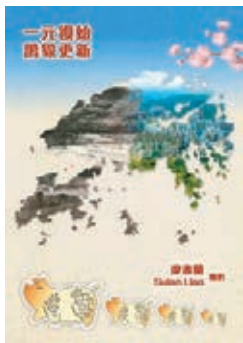
筆者向讀者拜個晚年，祝各位豬年諸事大吉，豬籠入水！

根據醫學報告，豬的智商很高，甚至比貓比狗還高，那一些對於豬不恰當的形容詞最好不要再用於豬的身上了。