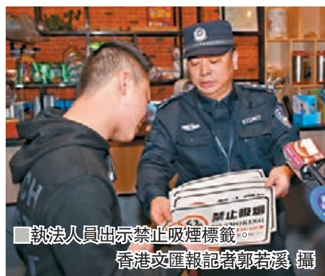
香港文匯報訊(記者 郭若溪 深圳報道)近日，《深圳經濟特區控制吸煙條例(修訂徵求意見稿)》向公眾徵求意見。據了解，此次修訂

徵求意見稿亮點頗多，不僅擬將電子煙納入控煙範圍，巴士站台、地鐵口等人流密集處也將禁止吸煙。