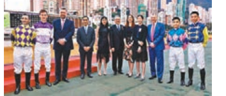
參與「香港賽馬會騎師馬術接力賽」的騎師與馬會高層合影。得頂尖馬術聯合、地區馬術會所及業界代表一同參與。來自世界各地與會者,將商討亞洲區內馬術運動的發展和策略。

這項被譽為室內場地障礙賽大滿貫的五星級馬術盛事,是2018/19年度的第二站賽事,當中焦點賽事包括「香港賽馬會騎師馬術接力賽」、「香港賽馬會亞洲挑戰賽」、「香港賽馬會亞洲青少年挑戰賽」及「香港賽馬會亞洲青少年大獎賽」。新設的3項亞洲錦標,標誌着馬術運動在區內發展的里程碑。第二屆「亞洲馬術周」今日起舉行,邀