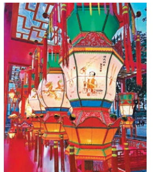
由非物質文化遺產辦事處策劃的傳統製作技藝展示在香港文化中心露天廣場舉行。