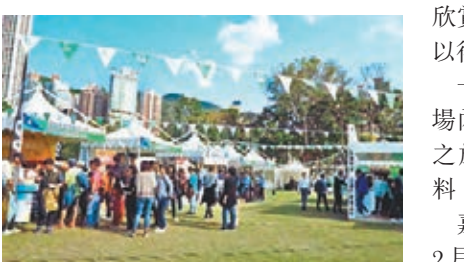
嘉年華的攤位吸引不少人參觀。

不過,有不少跑者在網上卻直指昨日領取跑手包的安排不當,要他們分開兩次排隊,分別領取號碼布和T恤,浪費不少時間,不少人表示花了兩個小時才能完成,批評有關安排「低能」、「不知所謂」。放工後從