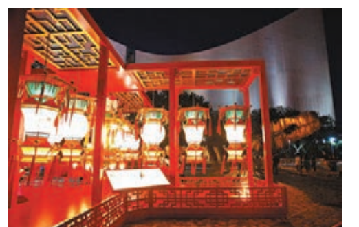
夜幕下的尖東文化廣場元宵綵燈會。