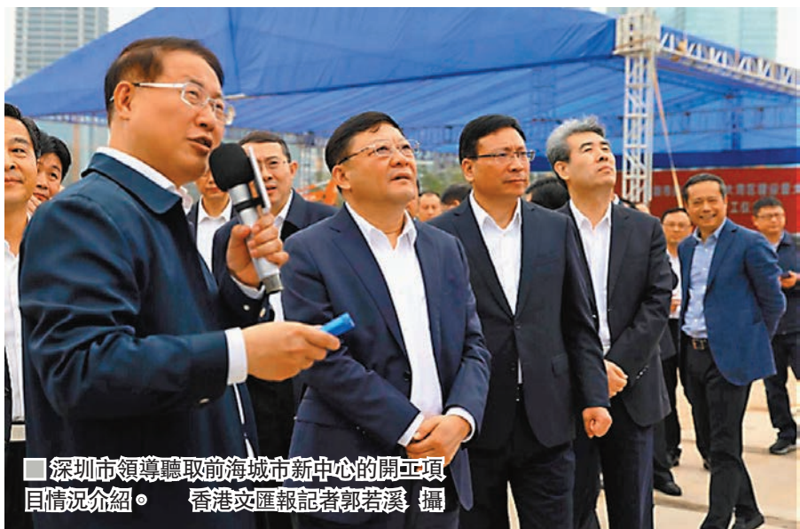
■ 深圳市領導聽取前海城市新中心的開工項目情況介紹。

香港文匯報訊（記者 郭若溪 深圳報導）在粵港澳大灣區發展規劃綱要即將出台之際，深圳市推進粵港澳大灣區建設重大項目昨日在前海集中開工，其中涉及多個深港合作項目，集中落地在前海和河套兩大創新支點，包括深港青年夢工場二期、香港科技大學創新項目、廣田深港國際科技園、深港生物醫藥創新研究院等。深圳為舉全市之力推進粵港澳大灣區建設，還將從交通、產業、公建、環境提升等多方面高水平建設多項配套設施，總計31個重大項目，總投資達748億元（人民幣，下同，約868億港元）。