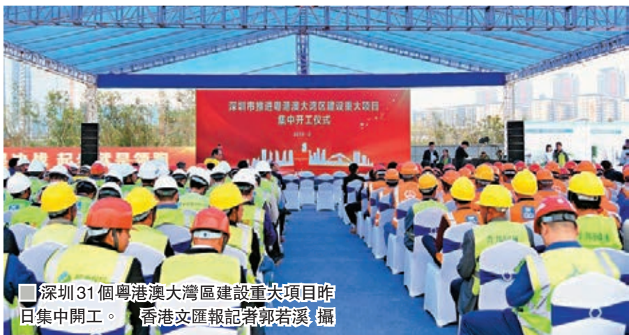
■ 深圳31個粵港澳大灣區建設重大項目昨日集中開工。

去年11月，深圳批覆了前海蛇口片區及大小南山周邊地區綜合規劃，總面積約37.9平方公里，前海作為城市新中心的地位日益明顯。