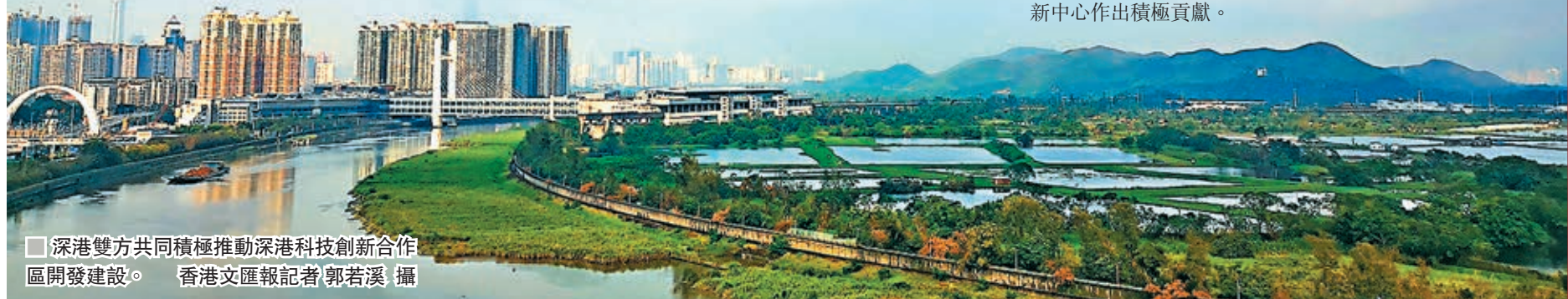
■ 深港雙方共同積極推動深港科技創新合作區開發建設。

先進技術研究院將依託與香港良好的合作基礎，連接內地和香港豐富的科創資源，在合作區深方區域組織開展基礎性、前瞻性、戰略性科技創新研究與人才培養，產生具有原始創新和自主知識產權的重大科技成果，雙方共同為將粵港澳大灣區打造成國際科技創新中心作出積極貢獻。