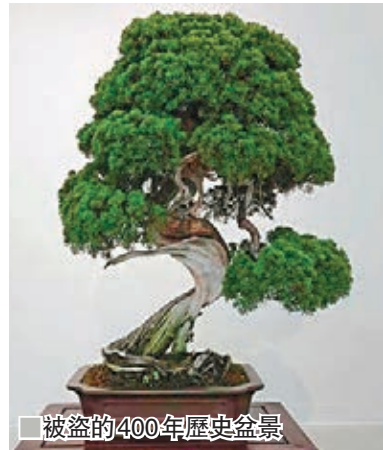
被盜的400年歷史盆景