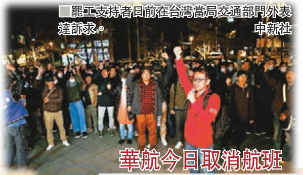
華航今日取消航班