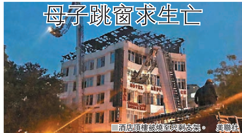
酒店頂樓被燒至只剩支架。

印度首都新德里一間酒店昨日凌晨疑因電線短路發生大火，造成最少17人死亡，當中大部分死者死於窒息，一對母子從5樓跳窗逃生時墮地身亡，另有5人受傷及3名緬甸旅客失蹤。當局出動最少25架消防車，灌救數小時後救熄大火，並救出35人。