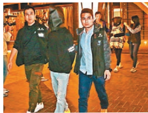
▲同居男女帶署;女疑犯(後)抱一名嬰兒。

▶片段所見,雖然煙花正在窗外連珠爆發,但屋內一對長者「一於好少理」,令人啼笑皆非。