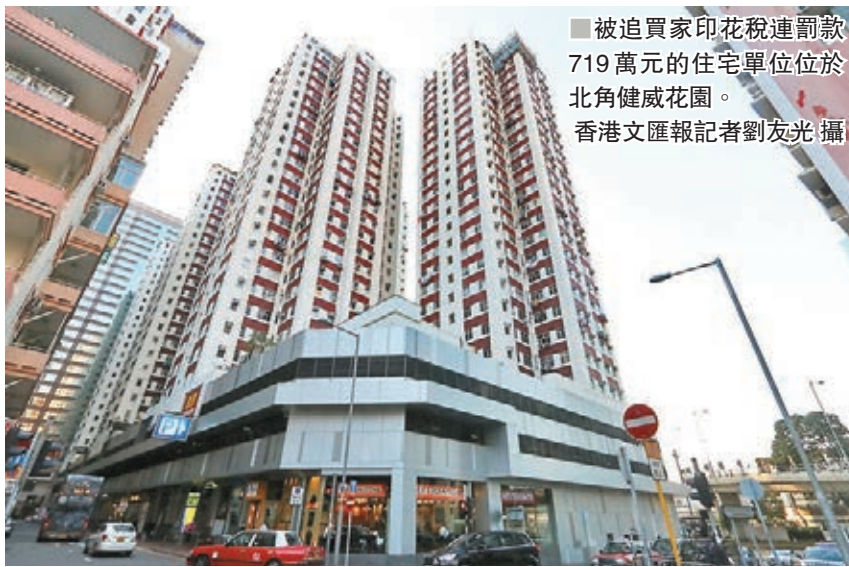
■被迫買家印花稅連罰款719萬元的住宅單位位於北角健威花園。

按照涉案樓宇價值,被告需繳付65.4萬元稅款。原告亦自2017年2月至去年12月,三度向被告追收有關稅款,但被告既無意繳費,也沒有申請補交