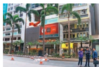
■混血男子由大廈天台跌落馬路中花槽位置當場死亡,警方一度封路進行調查。