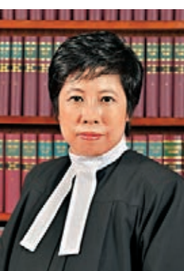
■暫委特委裁判官何麗明。資料圖片

香港文匯報訊(記者 葛婷)司法界近日發生裁判官下令拘捕大律師的罕見事件。東區裁判法院上月31日在處理一宗發生於2016年,涉及行人疏忽的交通意外案件時,暫委特委裁判官何麗明指辯方大狀梁耀祥於上月2日在庭上與其爭拗時,涉以一句「Are you insane? (你瘋了嗎?)」作出侮辱性言語,遂根據《裁判官條例》向梁簽發拘捕令。梁大狀昨向傳媒稱早前在庭上屢遭何官針對,澄清自己言論並非責罵,只是出於關心。又透露曾就何官的不當舉動提出司法覆核,雖然敗訴,但會於4月再提出上訴。