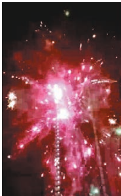
▲藍田公園「煙花匯演」歷時約1分鐘。

根據《危險物品條例》,任何人製造、貯存、管有、出售任何煙花炮仗,最高可判罰款2.5萬元及監禁6個月。