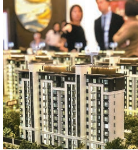
受車樓滯銷拖累，中國2018年消費增速跌破兩位數。資料圖片