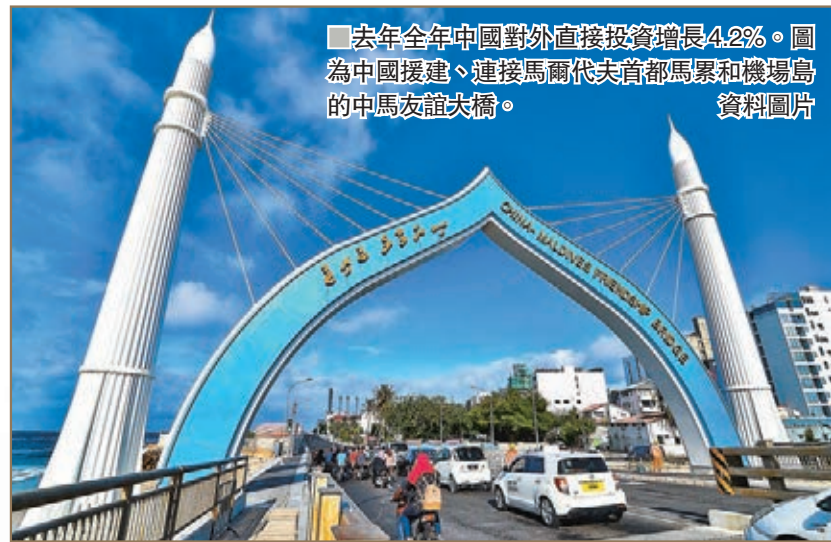
去年全年中國對外直接投資增長4.2%。圖為中國援建、連接馬爾代夫首都馬累和機場島的中馬友誼大橋。資料圖片