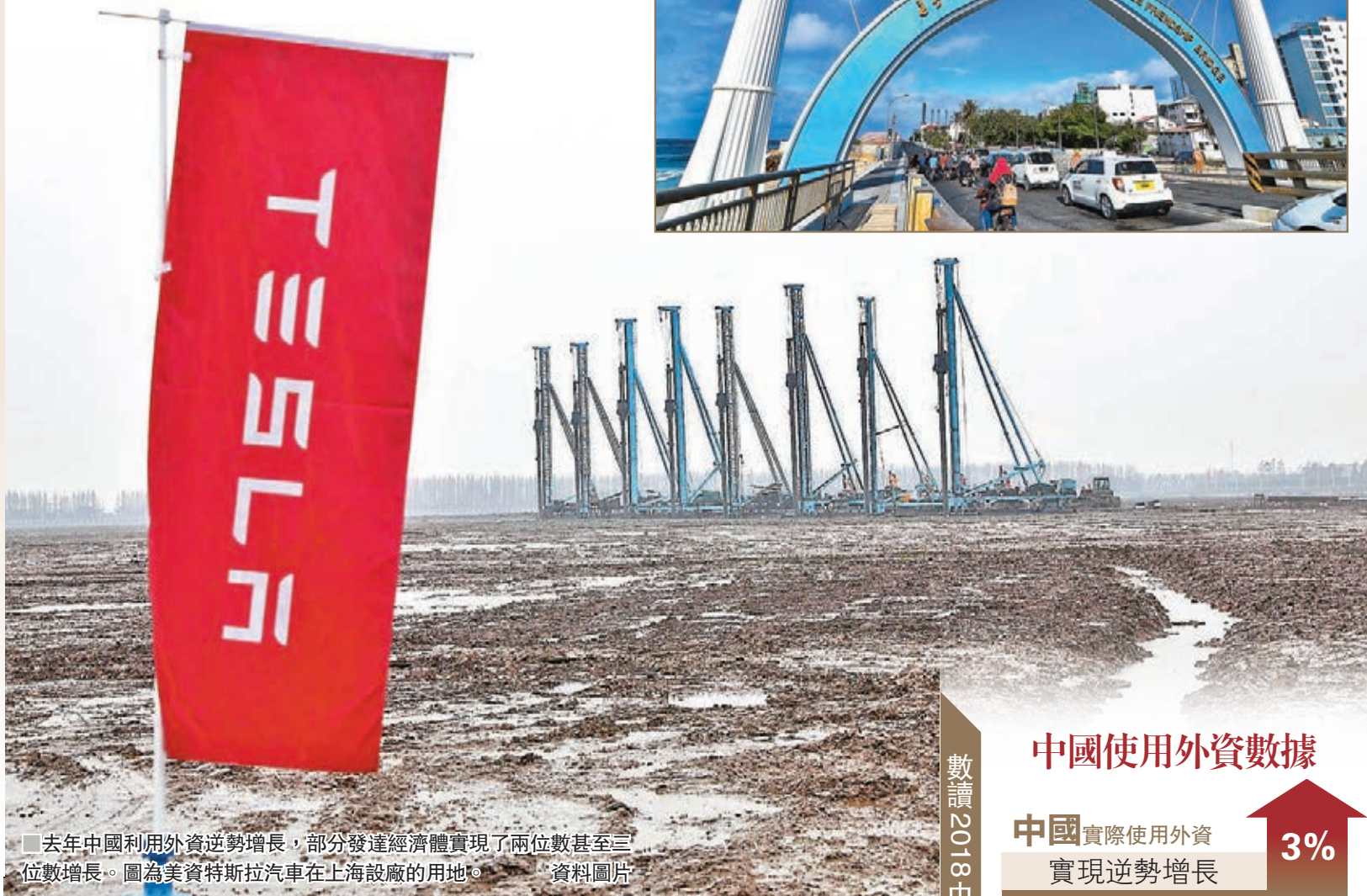
去年中國利用外資逆勢增長，部分發達經濟體實現了兩位數甚至三位數增長。圖為美資特斯拉汽車在上海設廠的用地。資料圖片

此外，對於今年外貿形勢，中國商務部綜合司司長儲士家表示，1月份中國貨物進出口仍然保持了增長態勢。預計2019年外貿發展仍有諸多有利因素，包括世界經濟仍將延續緩慢復甦態勢，中國主動擴大開放，穩外貿政策效應顯現等，都為中國外貿發展提供了強有力支撐。