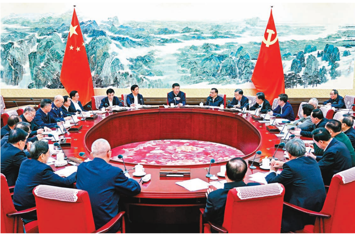
去年12月26日，中共中央政治局召開民主生活會，習近平主持會議並發表重要講話。

大家認為，中央政府駐港聯絡辦身處實行「一國兩制」的香港特別行政區，但在嚴格執行中央八項規定精神、堅決推進全面從嚴治黨上絕無特殊，必須始終注意防治「四風」問題，始終突出抓班子帶隊伍。黨的十八大以來，中聯辦按照中央部署，先後制定實施「中聯辦八條禁令」等一系列制度，從不在與香港市民交往過程中收受禮金及貴重禮品、出席香港社團組織和公司的活動不參加抽獎、婉拒節慶果籃禮籃等細節切入，多措并举、綜合治理，幹部隊伍作風建設取得顯著成效。特別是黨的十九大以來，中聯辦堅持以黨的政治建設為統領，深入學習貫徹習近平新時代中國特色社會主義思想和黨的十九大精神，嚴格遵守政治紀律和政治規矩，認真貫徹落實新修訂的《中共中央政治局貫徹落實中央八項規定實施細則》精神，進一步改作風轉作風。在改進調查研究方面，辦領導班子以上率下，深入社會、深入基層開展「大調研、深調研」，先後開展