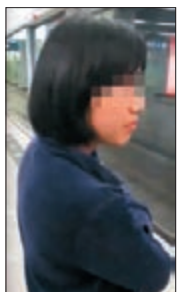
跟蹤兼盤問，會唔會狼吞少少呀？

跟蹤兼盤問對方，甚至拍埋片想公審對方。點知網民似乎就唔buy佢，仲要鬧爆佢離晒大譜，分分鐘報埋警拉佢都仲得！