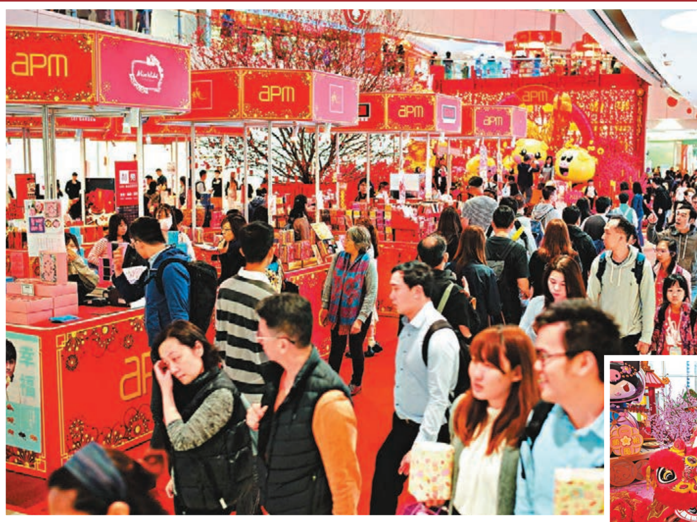
本港去年零售急速下滑,各大商場即出招應對,在新年期間推出各式優惠和活動吸引人流。