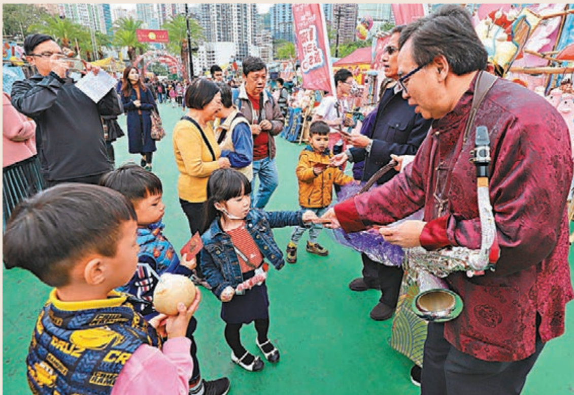
香港孩子主要「收入」大部分來自零用錢或拜年時所收到的利是等,調查指他們平均每星期有約180元的進賬。

香港文匯報訊(記者 馬翠媚)每逢農曆新年,作為晚輩的小朋友都逗得不少利是,部分父母或擔心小朋友「亂使錢」,而希望替他們儲起,不過有調查發現,現時8至15歲的孩子每年從零用錢或其他渠道會賺到約9,400元,當中有76%受訪孩子會積極參與儲蓄,並將錢存入銀行戶口中,同時亦有七成受訪孩子表示想透過儲蓄來學習如何理財。