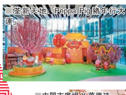
荃新天地「Peppa Pig豬年行大運」