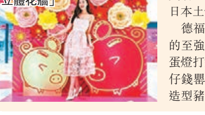
佛羅倫斯小鎮「錦繡紙藝立體花牆」