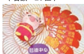
信德中心「金豬賀歲利是封」（名額：10位）