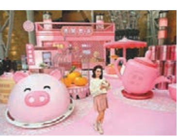
朗豪坊「豬事如意」賀新年

豬」在大堆金銀財寶簇擁下閃閃生輝，象徵財聚四方。利東街則打造全港最大型的戶外新春步行街，採用668個寓意圓滿、光明的金光紅燈籠及238個金光閃閃的金錢，加上中庭的「利東喜盈豬」增添喜慶。而D2 Place則變身「豬事叮」，打造一系列充滿節日氣氛的活動及佈置，更有不同節日工作坊以及精選主題市集，跟大家開心迎接新一年！超過60隻風箏翱翔於太古廣場，將新年的祝福帶遍商場每個角落。每一隻風箏均由著名香港設計師羅君兒創作，象徵各式傳統祝賀構圖八角形寓意祝福、蝴蝶寓意新年展翅高飛。