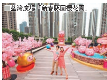
荃灣廣場「新春豚圓櫻花園」