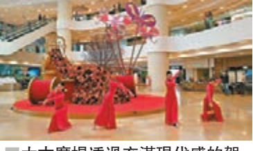
太古廣場透過充滿現代感的賀年裝置呈現出傳統中國新年的喜慶神髓。