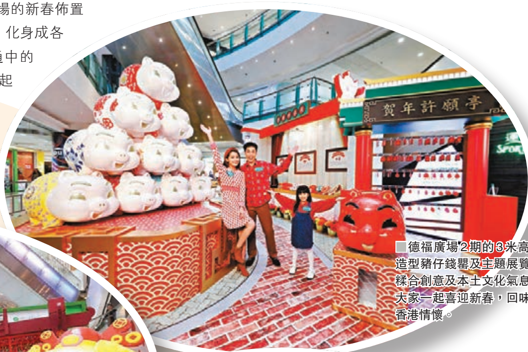
德福廣場2期的3米高特色造型豬仔錢罌及主題展覽區，揉合創意及本土文化氣息，與大家一起喜迎新春，回味昔日香港情懷。