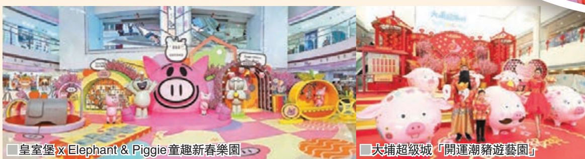
皇室堡x Elephant & Piggie 童趣新春樂園