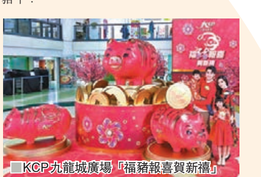
KCP九龍城廣場「福豬報喜賀新禧」

內以調色界指標Pantone的年度色活珊瑚橘作主色，飾以繽紛清麗的牡丹，將活力朝氣帶到商場，喜氣洋洋踏入己亥豬年！