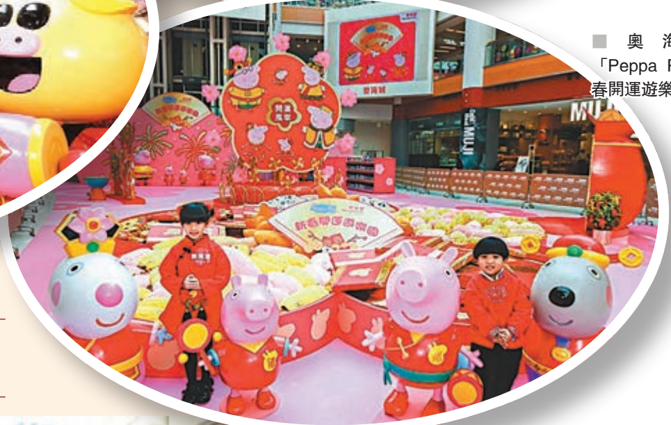
奧海城「Peppa Pig新春開運遊樂園」