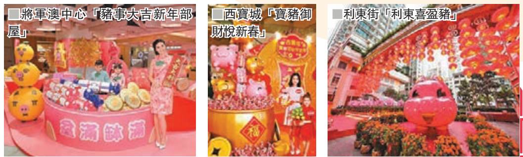
將軍澳中心「豬事大吉新年部屋」

韓國萌爆卡通人物粉紅BB豬Ddaengi一家福氣滿滿趁着豬年出遊飛出首爾，蒞臨陽光房地產基金旗下兩大商場新都城中心一期（MCPOne）及上水中心購物商場（SSC）跟大家拜年，更特別精心呈獻「Ddaengi韓風『遊』樂新春！」，送上傳統特色的新春韓宮，打造韓流人氣打卡勝地，如韓屋村及繡球花路，讓大家不用遠飛韓國，都能感受地道的韓式新年。奧海城與荃新天地則聯同小朋友至愛的Peppa Pig攜手帶大家過一個開心豬年。奧海城「Peppa Pig新春開運遊樂園」特設5個新春開運區，有LED煙花佈景、5米高開運風車、5米巨型全盒、DIY大型福袋磁石牆以及鼓勁舞獅區，Peppa Pig與家人及一眾朋友們以全新農曆新年造型同大家拜年！至於荃新天地的「Peppa Pig豬年行大運」，全場焦點必定落在近5米高的步步高陞開運熱氣球及場內多棵桃花樹、舞獅梅花樁及18米長金龍，讓大家可以穿龍肚，行大運，祝願大家新年金玉滿堂，好事齊來！荃灣廣場以「祝福、豚圓」為新春主題，以可愛浪漫風特設「新春豚圓櫻花園」，由即日起至2月17日期間，一個個趣致可愛的七彩達摩吉祥豬於5樓太空樂園為大家準備5大祈福打卡位，如6米高的「巨型祝福塔」、「祈福祝願寺」等，只要與親朋摯愛在園內走一圈，新年一定必喜樂平安。萬樂珠（Mentos）於全球逾百個國家有售，多年來深受大小朋友歡迎。今個新年，屯門市廣場聯同萬樂珠攜手打造全亞洲首個大型主題裝置「新春遊樂園」，一系列新春造型的可愛萬樂「豬」將首次現身香港，祝賀大家新年「豬」事順利。