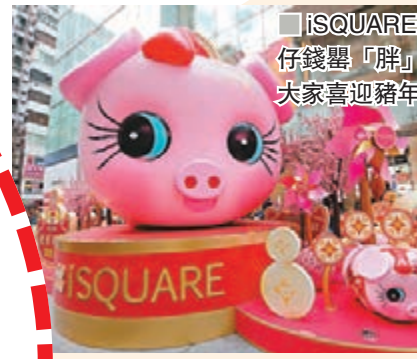
iSQUARE豬仔錢罌「胖」住大家喜迎豬年。