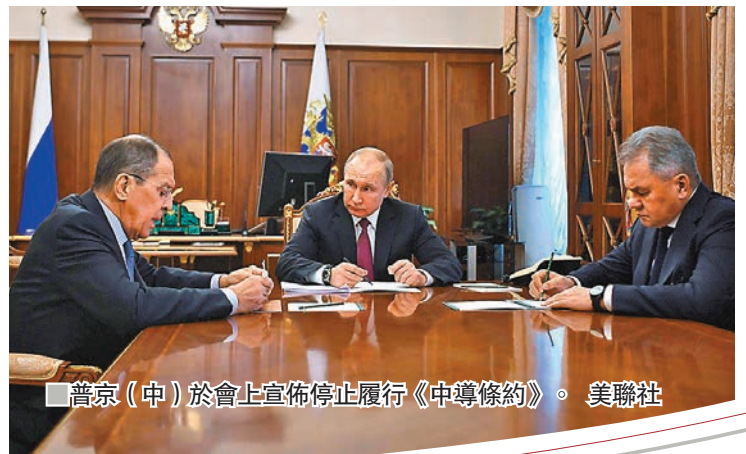
■普京(中)於會上宣佈停止履行《中導條約》。