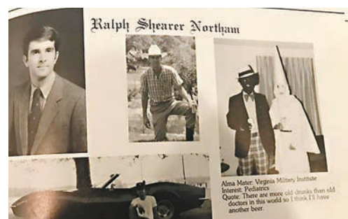
■諾瑟姆畢業紀念冊中的爭議照片(圖右)。

美國弗吉尼亞州民主黨籍州長諾瑟姆日前捲入種族歧視爭議，他在1984年醫學院畢業紀念冊的一張照片中，穿上帶有種族主義含意的服飾，在照片曝光後，迅即遭民主黨人猛烈抨擊，紛紛要求他下台。諾瑟姆前日為事件致歉，但拒絕辭職。