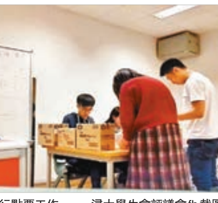
工作人員正進行點票工作。

度，便隨意頂着所謂「學生代表」頭銜遊走大學校園，不務正業。香港研究協會上月在各大學校園訪問11所大學的逾千名學生，六成批評所屬學生會不能維護同學權益，過分政治化更是各學生會的通病，似乎隱約反映了是次周年大選終成鬧劇的原因。