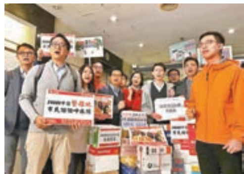
工聯會昨日請願，要求政府優化4,000元「關愛共享計劃」申請手續。

工聯會促請政府優化申請手續，提供電子化申請，在方便市民的同時提升辦事效率，減少紙張浪費。工聯會並要求政府加強宣傳，又指社區有不少家庭都使用聯名戶口，不少人沒有銀行戶口，現時表格上沒有欄目讓申請者填寫此備註事項，建議政府放寬不接納聯名銀行戶口匯款的做法。