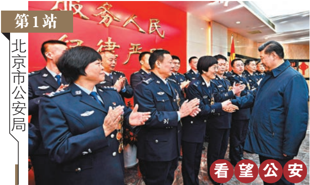
第1站 北京市公安局

在與順豐速遞投遞點的快遞小哥交談時，習近平說到：「全國快遞從業者有300多萬，他們都在辛勤工作。」他對快遞員親切表達關懷與慰問。其中一位受到看望慰問的快遞員告訴香港文匯報記者，今年元旦，習近平主席發表新年賀詞，在講到「2019年，有挑戰也有機遇，大家還要一起拚搏，一起奮鬥」時，特別提到「這個時候，快遞小哥、環衛工人、出租車司機以及千千萬萬的勞動者，還在辛勤工作，我們要感謝這些美好生活的創造者、守護者。大家辛苦了。」這些溫暖的話語給予了像他一樣的「追夢人」很大鼓勵。此次又收到習主席的春節慰問與關心，一定繼續撻起袖子加油幹。