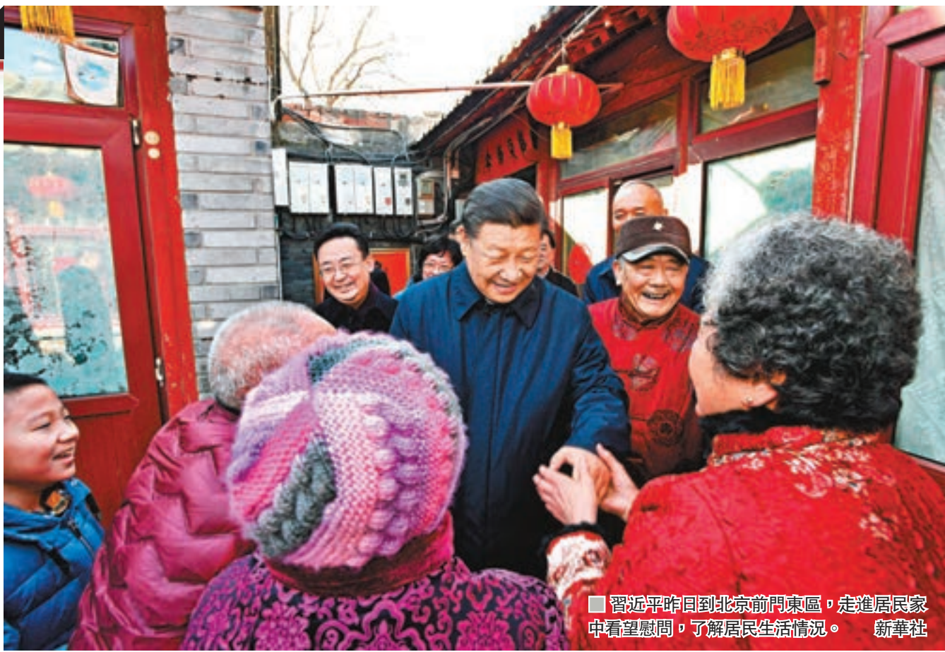
■ 習近平昨日到北京前門東區，走進居民家中看望慰問，了解居民生活情況。新華社

香港文匯報訊 綜合記者張聰、央視網及新華視點報道，中華民族傳統節日農曆春節來臨之際，中共中央總書記、國家主席、中央軍委主席習近平昨在北京看望慰問基層幹部群眾，向全國各族人民致以美好的新春祝福。「祝我們的人民不斷過上更好的幸福生活，祝福國家繁榮昌盛，祝福大家家和業興、新春愉快！」