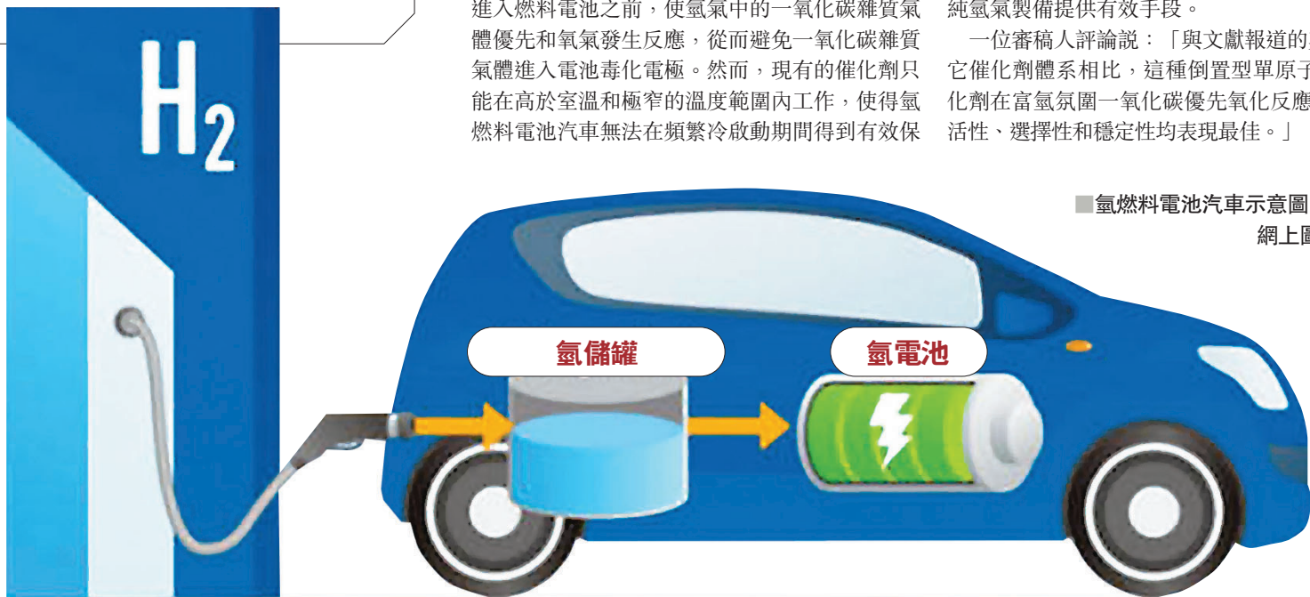
■ 氫燃料電池汽車示意圖。