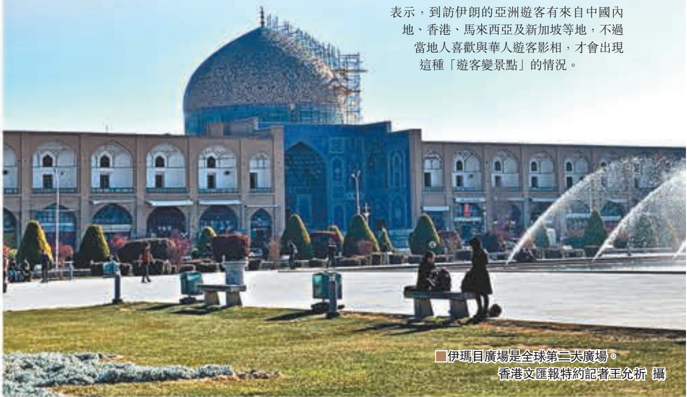
伊瑪目廣場是全球第二大廣場。

在設拉子及伊斯法罕等旅遊城市，亞洲人面孔比較少見，有一團香港遊客參觀伊斯法罕伊瑪目廣場時，被一群小學生包圍及要求合照。Reza表示，到訪伊朗的亞洲遊客有來自中國內地、香港、馬來西亞及新加坡等地，不過當地人喜歡與華人遊客合影，才會出現這種「遊客變景點」的情況。