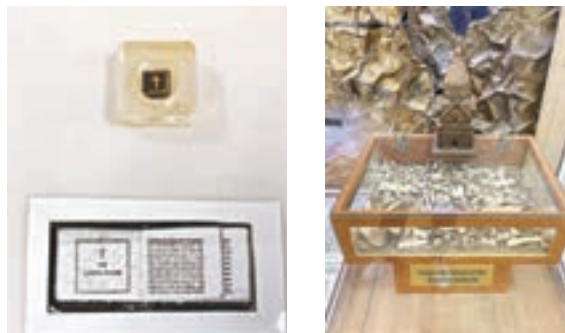
教堂內陳列全球最小的《聖經》及大屠殺的證據。

伊朗有「伊斯法罕半天下」的諺語，讚譽伊朗第三大城市伊斯法罕建築精美。雖然伊朗以穆斯林為主，境內清真寺眾多，但伊斯法罕不會「獨沽一味」，有4至5間基督教教堂，當中有兩間開放，包括記錄亞美尼亞大屠殺歷史的Vank cathedral (凡克主教堂)。