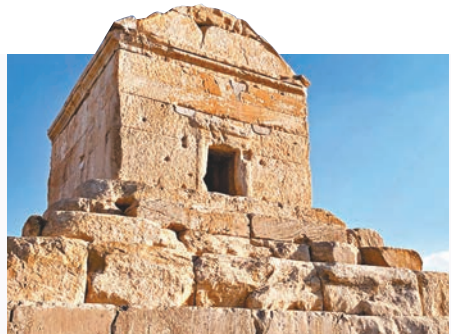
有人參拜居魯士大帝墓時表達反政府思想。