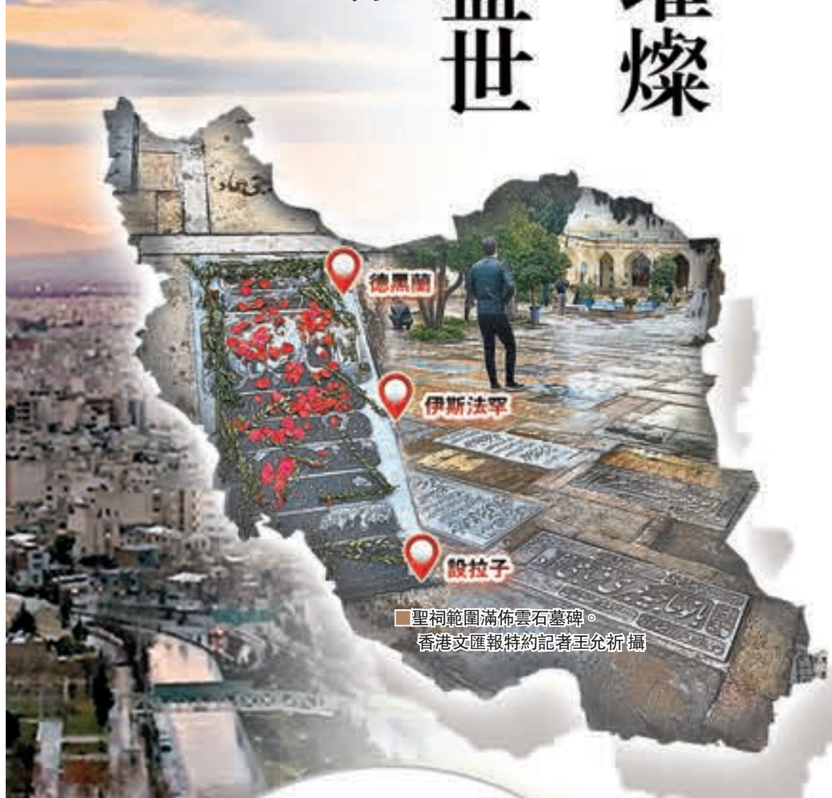
聖祠範圍滿佈雲石墓碑。

添一道當代政治色彩。香港文匯報特約記者王允祈 伊朗設拉子、伊斯法罕報導 反政府言論，當局遂禁止公眾於10月的紀念日前來參拜，讓年代悠久的遺跡平魯士大帝陵墓所在地。導遊 Reza 向記者表示，由於曾有人參拜帝墓時，發表波斯波利斯的建築及雕塑展示波斯文明的燦爛，而帕薩爾加德則是波斯帝國創建者居魯士大帝陵墓所在地。波斯波利斯的建築及雕塑展示波斯文明的燦爛，而帕薩爾加德則是波斯帝國創建者居魯士大帝陵墓所在地。波斯波利斯的建築及雕塑展示波斯文明的燦爛，而帕薩爾加德則是波斯帝國創建者居魯士大帝陵墓所在地。