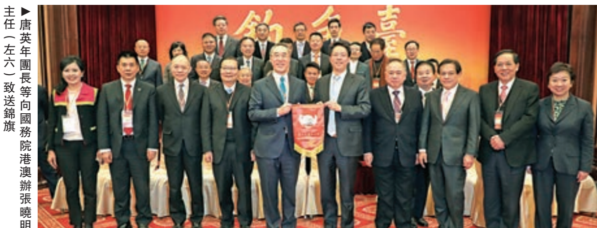
▶唐英年團長等向國務院港澳辦張曉明主任(左六)一致送錦旗