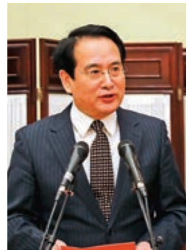
▲中共中央統戰部副部長譚天星