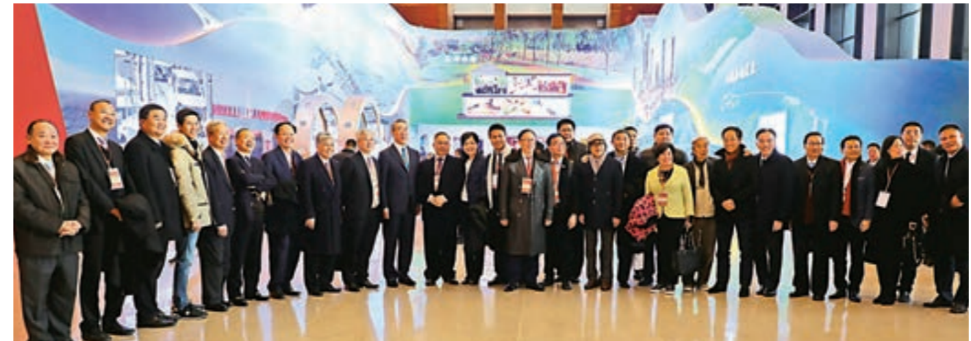
▲訪京團參觀《偉大的變革——慶祝改革開放40周年大型展覽》