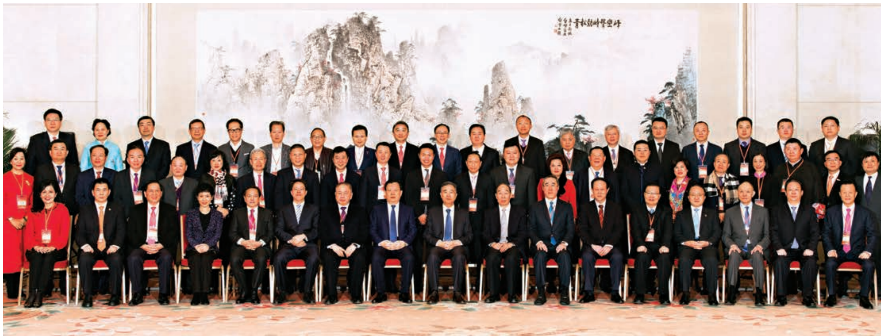
▲中共中央政治局常委、全國政協汪洋主席，中央書記處書記、中共中央統戰部尤權部長，全國政協夏寶龍副主席兼秘書長等領導與訪京團合照