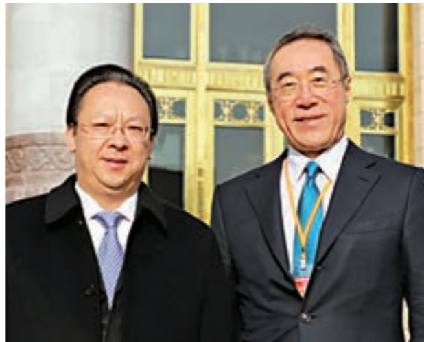
▲左起：香港中聯辦譚鐵牛副主任、唐英年團長