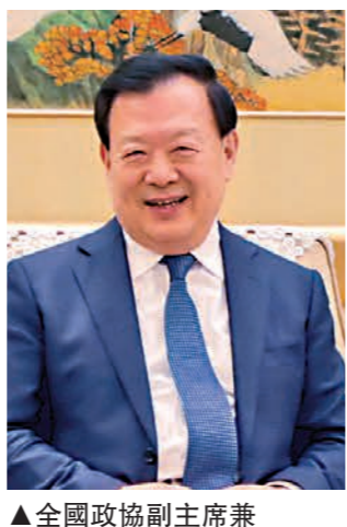
▲全國政協副主席兼秘書長夏寶龍