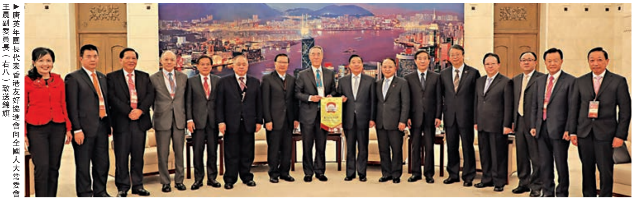
▶唐英年團長代表香港友好協進會向全國人大常委會王晨副委員長(右八)致送錦旗