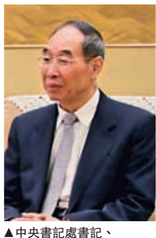
▲中央書記處書記、中共中央統戰部尤權部長