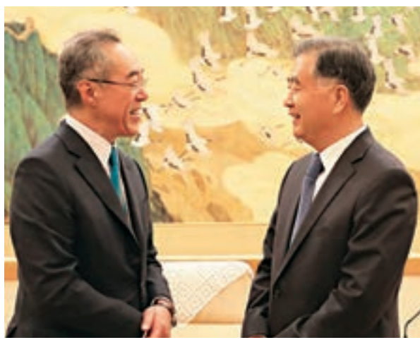
▲全國政協汪洋主席(右)會見唐英年團長