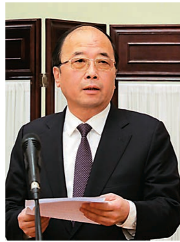
▲中共中央統戰部常務副部長張裔炯