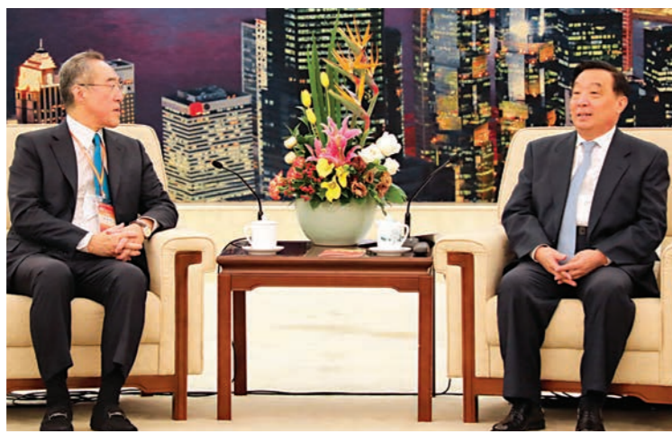
▲全國人大常委會王晨副委員長(右)與唐英年團長親切交談