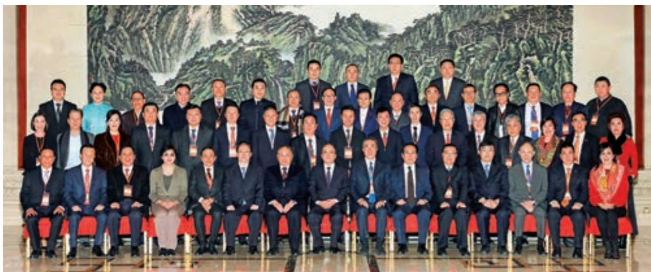
▲中共中央統戰部常務副部長張裔炯、副部長譚天星等領導與訪京團合影

以香港中聯辦王志民主主任任榮譽團長、香港中聯辦譚鐵牛副主任任榮譽顧問、香港友好協進會唐英年會長任團長的香港友好協進會訪京團，2018年12月13日到14日訪問北京，分別拜訪了全國人大常委會、全國政協、中共中央統戰部和國務院港澳辦，並參觀了《偉大的變革——慶祝改革開放40周年大型展覽》，行程緊湊、成果豐碩、圓滿成功。