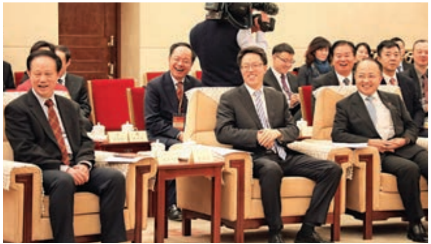
▲左起：全國政協常務副秘書長潘立剛、國務院港澳辦張曉明主任、香港中聯辦王志民主主任