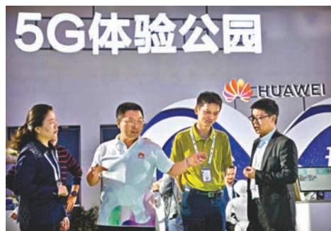
■《紐約時報》報道聲稱美國政府去年秘密向各國盟友施壓，要求聯手阻止華為參與全球5G網絡建設。資料圖片

國家打壓中國企業問題表明了中方的嚴正立場。王毅指出，在沒有任何證據的情況下動用國家力量來抹黑和打擊特定的企業，這種做法既不公平，也不道德。一國當然有權利維護國家的信息安全，但不能打着安全的幌子，以莫須有的借口損害甚至扼殺企業的合法正當經營，對於這種無理做法和霸凌行徑，各國都應予以警惕和抵制。