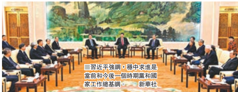
■習近平強調，穩中求進是當前和今後一個時期黨和國家工作總基調。新華社

香港文匯報訊 據新華社報道，在中華民族傳統節日己亥豬年春節即將到來之際，中共中央總書記、國家主席、中央軍委主席習近平昨日下午在人民大會堂同各民主黨派中央、全國工商聯負責人及無黨派人士代表歡聚一堂，共迎佳節。習近平代表中共中央，向各民主黨派、工商聯和無黨派人士，向統一戰線廣大成員，致以誠摯的問候和新春的祝福。習近平強調，穩中求進是當前和今後一個時期黨和國家工作總基調。我們做工作就要以穩求進、以進固穩，經濟發展是這樣，社會發展也是這樣。