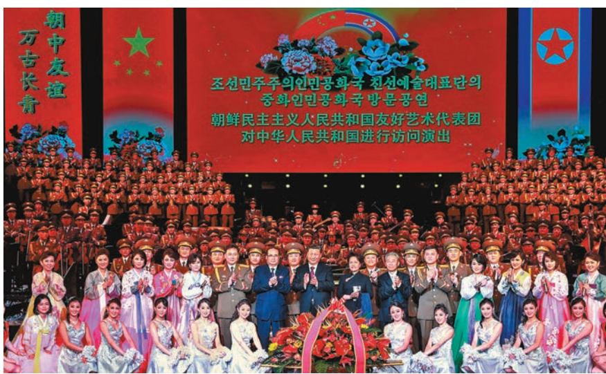
■演出結束後，習近平和彭麗媛上台同職演人員合影留念，祝賀演出成功。

耿爽說，今年是中朝建交70周年。中方願同朝方一道，把兩黨兩國最高領導人的重要共識落到實處，加強各領域交流合作，進一步造福兩國人民，也為地區和世界和平、穩定、發展、繁榮作出積極貢獻。