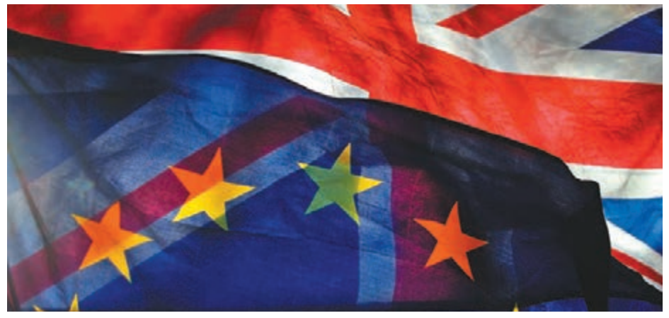
英國脫歐未解決等「灰犀牛事件」持續發酵，有利資金流入黃金資產避險。資料圖片

雖然近期投資氣氛有所改善，令具避險功能的黃金價格自去年11月尾顯著上升後暫時回順(圖)，但筆者於上一年末所指出的「灰犀牛事件」(中美科技戰開打、美國經濟及企業盈利增長放緩、英國脫歐未解決等)迄今仍困擾環球市場。投資者可趁機預先部署相關基金，在全球避險情緒再度高漲之際，捕捉金價上升潛力。