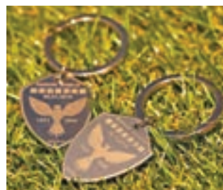
■入場球迷可憑票尾免費換紀念匙扣一個。

傑志今季成績有所回落，華杜斯回歸後尚未重拾最佳狀態，不過這位香港足球先生有信心球隊可以重掌主動：「傑志今季聯賽排名雖然有所下降，不過我們的實力沒有多大分別，我們永遠有信心擊敗任何對手，決賽