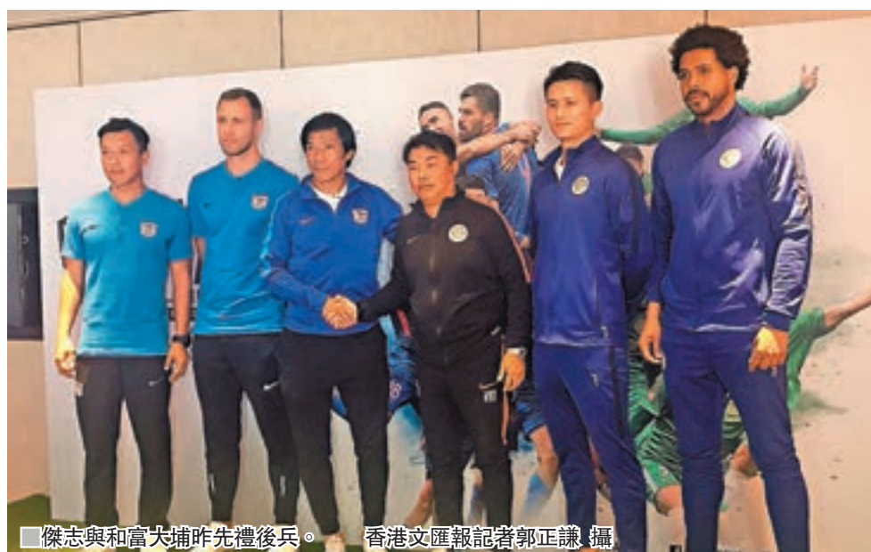
■傑志與和富大埔昨先禮後兵。

對每一位球員而言都是一個特別的時刻，我們會將最好的一面呈現在球迷面前。」 另外高級組銀牌決賽當日，入場球迷可憑票尾於場內指定地點免費換領紀念匙扣一個，名額2000個。