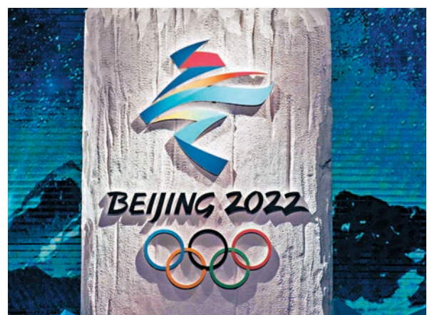
年高山滑雪世界盃及其測試賽等。此外，北京市還將繼續承辦NHL(北美職業冰球聯盟)中國盃比賽、單板滑雪大跳台世界盃等國際賽事。■香港文匯報記者 陳曉莉

除北京冬奧會測試賽，北京也將從今年起陸續舉辦一批高水平的冰雪賽事，包括國際雪聯越野滑雪積分賽和滑輪世界盃、女子冰球世界錦標賽(甲級B組)、冰壺世界盃總決賽、全國冰球錦標賽，以及2020年和2021