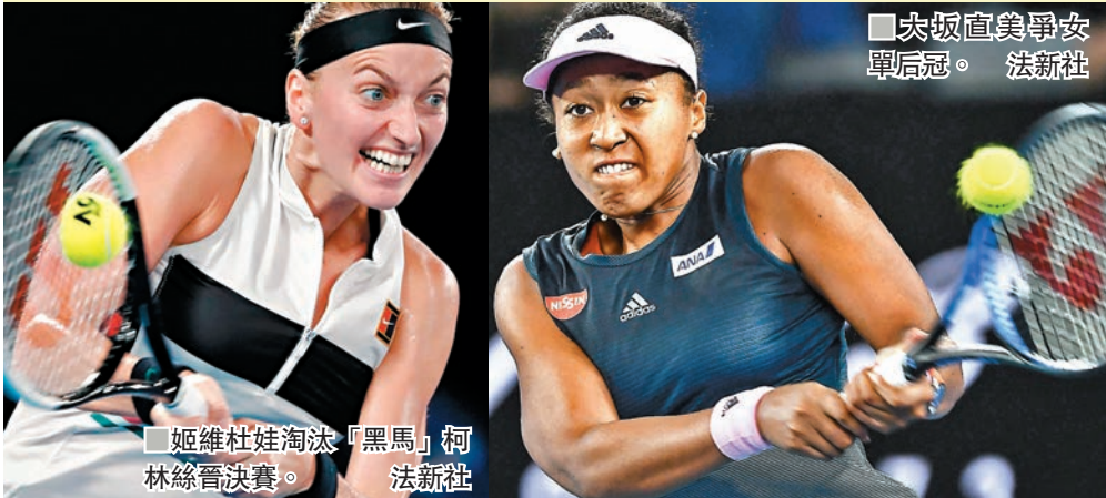
■姬維杜娃淘汰「黑馬」柯林絲晉級決賽。