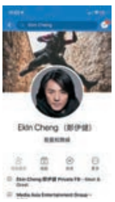
此 Facebook 賬號冒認鄭伊健。

回應說：「一睇寫咁多字就知唔係我啦！我好感恩我的粉絲咁醒目，有懷疑就即刻通知我公司處理，大家咁乖，我會更加努力練歌同排舞，演唱會仲有驚喜畀大家！(咁你有冇用公文包?) 公文包?我個袋得支水同遊戲機，現在人大了，身外物唔見了就算。(平時有冇同粉絲聯絡?) 我們仲用緊飛鴿傳書！」