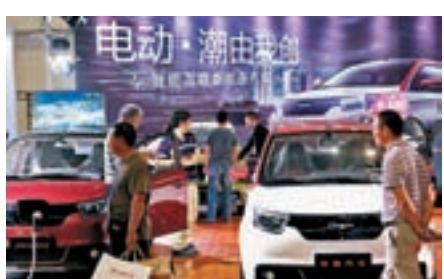
■中國GDP增長將更倚重消費，重視質量。

中國不再以GDP論英雄，然而世界對中國經濟增速特別關注，畢竟中國是全球第一大經濟引擎，給全球經濟貢獻近30%。中國經濟放緩，全球經濟增長當然受影響。中國90萬億的GDP，帶給全球希望和願景。