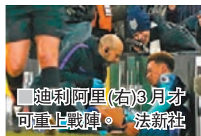
迪利阿里(右)3月才可重返戰場。

熱刺會方22日宣佈，日前聯賽傷出的中場主將迪利阿里證實腿筋受傷，將需休戰約兩個月，最快3月初才可復操。阿里今季為熱刺上陣25場，貢獻7入球及4助攻。在原本已有首席射手哈利卡尼養傷到3月份，以及另一鋒將孫興民踢亞洲盃暫時離營到2月初，熱刺頓失隊中四大得分手三人，攻擊線恐將