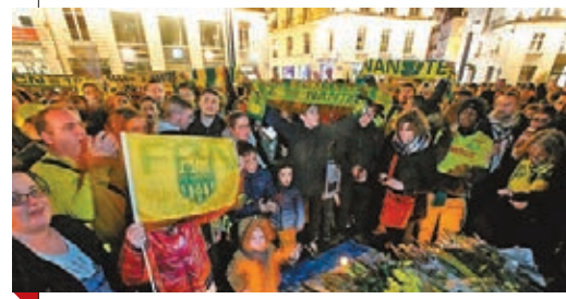
大批南特球迷聚集廣場，為伊美利安奴沙拿祈禱。