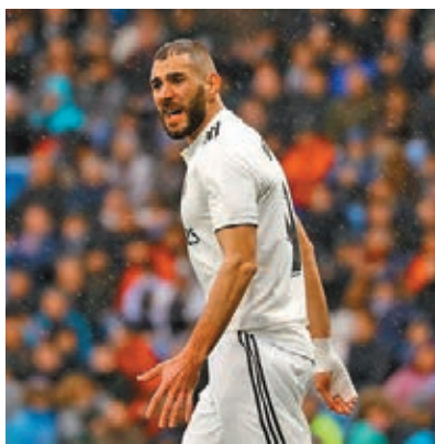
右手受創的實施馬將帶傷出戰。