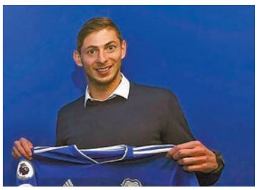
伊美利安奴沙拿數天前落實加盟沙拿祈禱。卡迪夫城。法新社

阿根廷足球員伊美利安奴沙拿乘坐的小型飛機21日晚在英吉利海峽上空失聯，生死未卜。一段沙拿在飛機失聯前的語音訊息提到「飛機似快要解體」，好像預感會遭到意外。