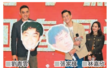
劉青雲 張家輝 林嘉欣

香港文匯報訊 劉青雲、張家輝、林嘉欣、方中信、陳家樂等昨在北京出席新片發佈會，電影以CG技術為觀眾呈現年輕時的青雲與家輝，當看到「21歲的自己」，兩位影帝都不禁調侃一番，青雲認為：「家輝真係好特別，睇佢後生係無辦法想像到佢現在嘅樣，我就好簡單，一睇就知我係「明星樣」。」家輝則表示：「自己後生就比較憤怒，而後生的青雲就比較天真和善良。」