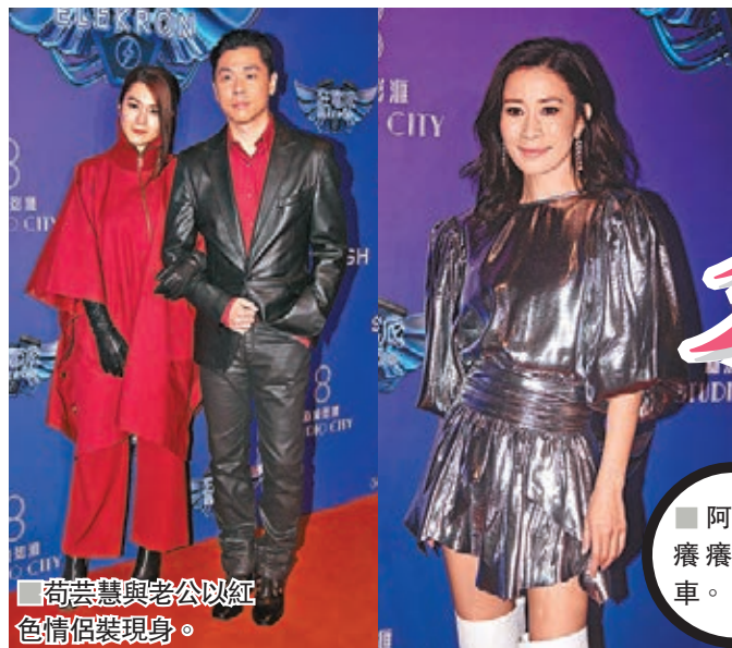
荷芸慧與老公以紅色情侶裝現身。