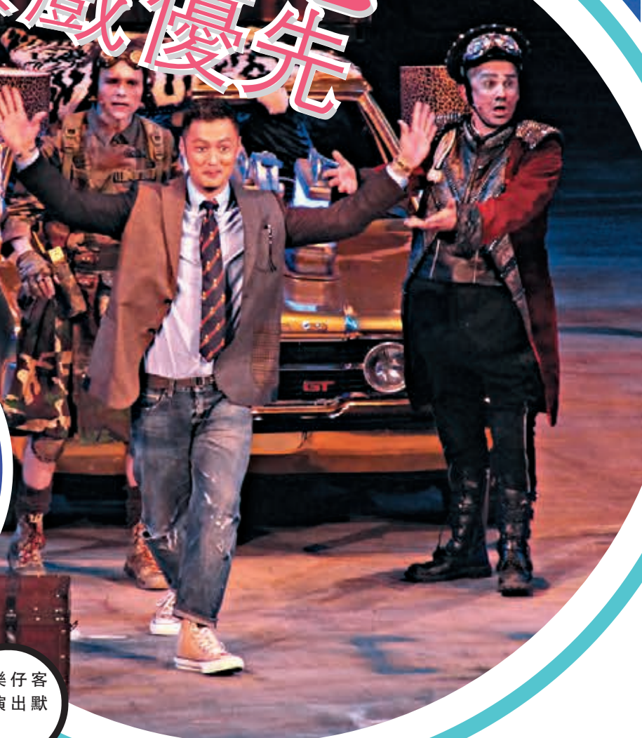
樂仔客串演出默劇。