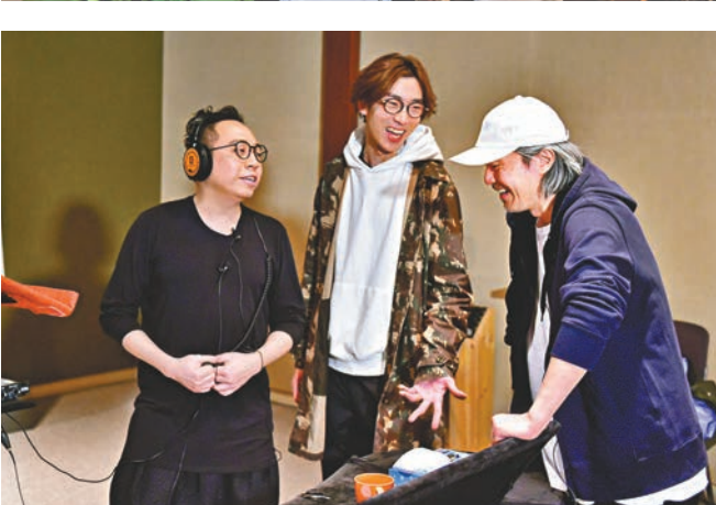
星爺與農夫首次合作已一拍即合。