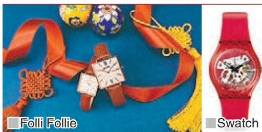
Folli Follie Swatch

如你是一位分秒必爭的人，不妨選擇紅色的腕錶，為自己添上一點旺氣。例如，Swatch Rosso Bianco 便以紅色錶帶及錶面設計，戴上手非常搶眼。