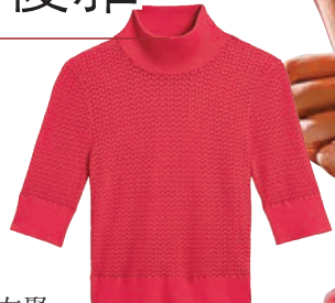
alice + olivia

而且，除了傳統的大紅配襯外，與朋友聚會時穿上華麗的花卉刺繡單品，今季最流行的 animal print 外套配搭造型，立即增添時尚和流行的色彩。而以型格和時尚紅色格仔重新演繹長袖襯衫連身裙，適合早晚不同場合的穿着。