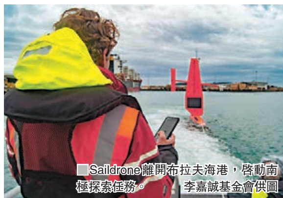
▲Saildrone離開布拉夫海峽，啟動南極探險任務。

香港文匯報訊（記者 高鈺）李嘉誠基金會以100萬美元（約784萬港元）贊助的「Saildrone南極環流探索」計劃正式啟動，由美國海洋數據供應商Saildrone派出兩艘無人駕駛的航探儀，已於本月20日在紐西蘭最南端的布拉夫順利出發至南極，展開270日的科學之旅，成為史上首支前往南極的無人駕駛航行隊伍。