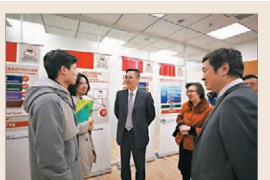
局長珠海交流 粵港澳大灣區規劃出台在即，高等教育發展是其中一個受關注的領域。教育局局長楊潤雄昨日前往珠海，探訪香港首間與內地合辦的高等院校北京師範大學—香港浸會大學聯合國際學院（UIC）。他讚揚UIC是兩地合作辦學的典範，認為本港大學於大灣區發展空間很大，香港高教的經驗及與國際接軌的辦學模式，能與內地高等院校結合並發揮協同效應，對培養大灣區人才非常重要。