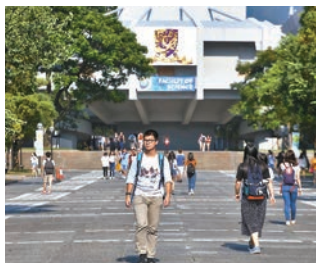
▲中大宣佈更多靈活收生措施，包括改用「擇優分數換算」。資料圖片

新做法較有利於個別專長科目「摘星」的單科尖子，以兩名最佳5科分別為「44444」及「5**5**222」總分同為20分的學生為例，前者新換算維持20分，但後者卻增至23分明顯更具優勢。