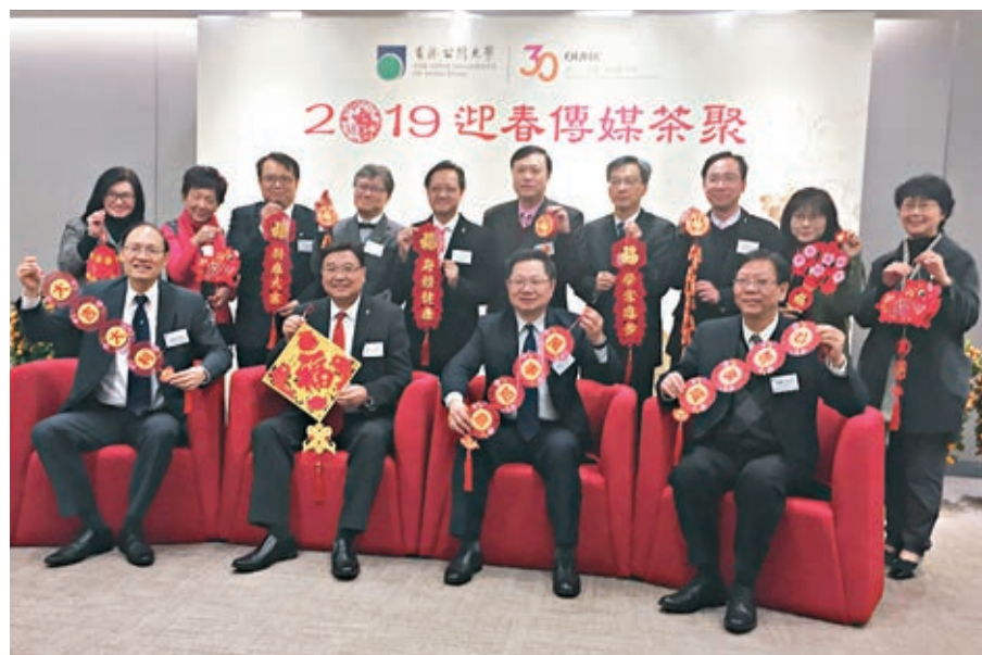
公大昨舉行迎春傳媒茶敘，公佈未來五年的發展策略。

黃玉山補充，由於香港欠缺脊醫相關的設備與人才，故將與美國的大學商討合辦博士課程事宜。