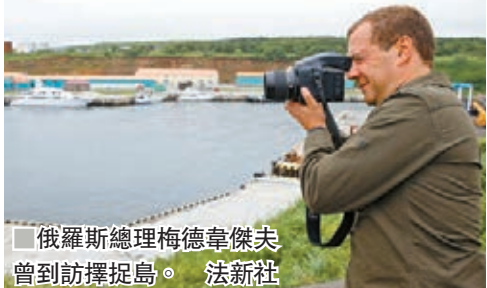
俄羅斯總理梅德韋傑夫曾到訪擇捉島。法新社

莫斯科是安倍歐洲外訪行程的第一站，他今日將前往瑞士出席達沃斯世界經濟論壇，並在會上發表演說。法新社/美聯社/路透社