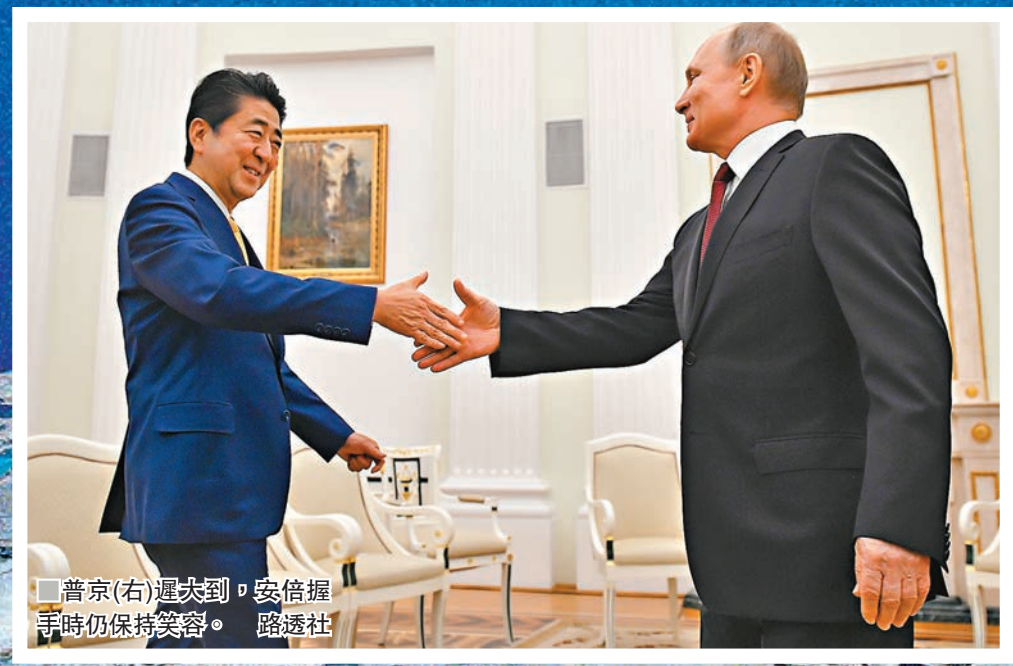
普京(右)遲未到，安倍握手時仍保持笑容。

國後島和擇捉島之間的海峽在冬天不結冰，令駐紮海參崴的俄羅斯艦隊及潛艇可全年進入太平洋。俄羅斯在群島上設軍事基地及部署導彈系統，群島亦蘊藏豐富礦物及稀有金屬資源。