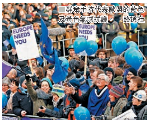
群眾手持代表歐盟的藍色及黃色氣球抗議。路透社

有群眾昨日在亞琛政府大樓外集會，他們手持代表歐盟的藍色及黃色氣球，也有人身穿黃背心，聲援法國的反政府「黃背心」示威。德國極右政黨「德國另類選擇黨」(AfD)領袖高蘭表示，法國「黃背心」運動未平，反映馬克龍無能力恢復國家秩序，認為默克爾不應將德國未來前途寄託在馬克龍身上。路透社/法新社