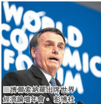
博爾索納羅出席世界經濟論壇年會。