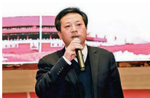
香港江西社團(聯誼)總會赴贛參訪團參加國家級南昌小藍經濟技術開發區招商引資推介會。圖為南昌縣委書記、小藍經開區黨工委書記胡曉海致歡迎辭。

年，我在江西投資2億(人民幣，下同)發展高端製造業；今年，我準備在江西投建總額達133億的科創產業園。我要以我的實際行動，影響周邊的朋友，讓大家知道家鄉的投資環境十分優越，讓大家知道家鄉的未來十分值得期待。」他同時感謝劉奇書記及各位領導百忙之中參加此次回訪活動，此次活動意義重大，將有力促進贛港兩地經貿合作交流與發展。