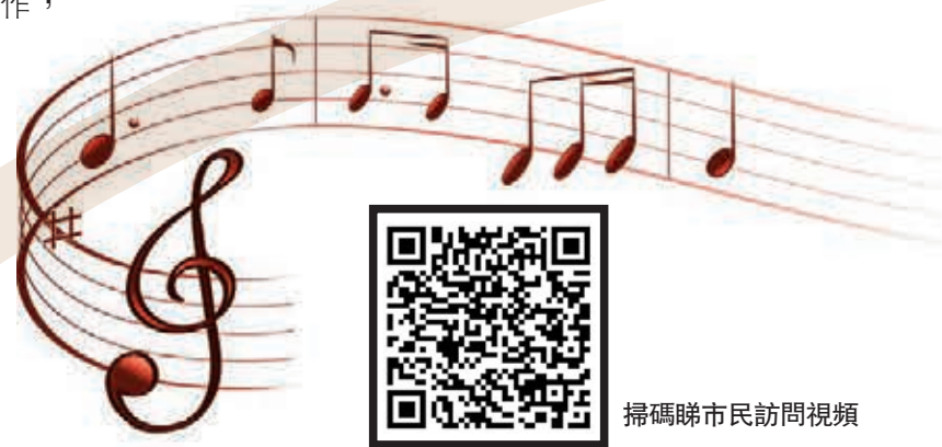
掃碼睇市民訪問視頻