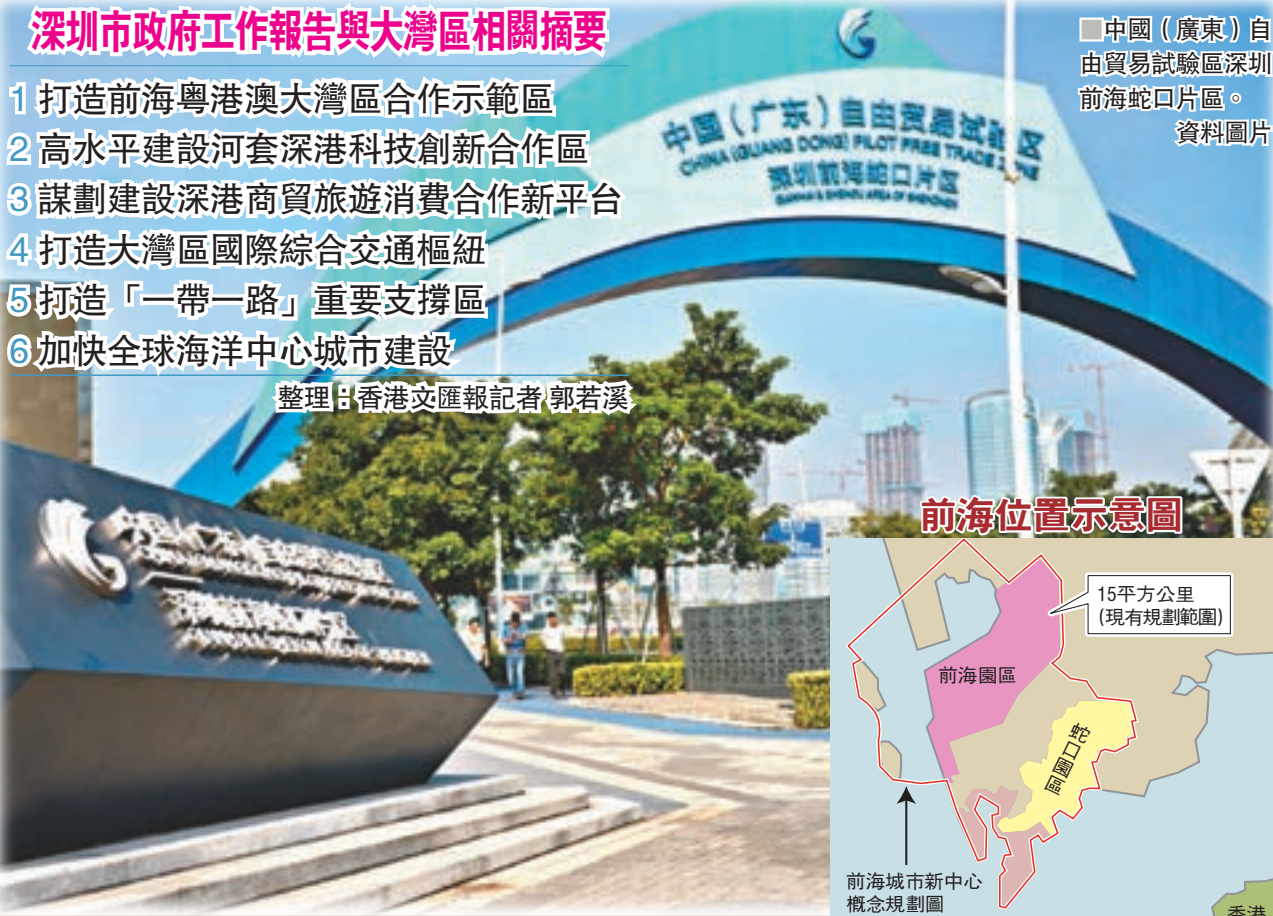
中國(廣東)自由貿易試驗區深圳前海蛇口片區。 資料圖片