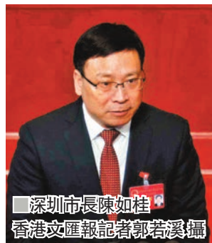
深圳市長陳如桂

昨日,深圳市六屆人大七次會議開幕,深圳市委副書記、市長陳如桂在政府工作報告中7次提及粵港澳大灣區,指出將深度對接港澳所需、深圳所能、灣區所向,今年將開展前海總規修編,推動前海合作區擴區,總結拓展「前海模式」。