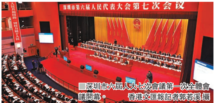
深圳六屆人大七次會議第一次全體會議開幕。

粵港澳大灣區作為國家戰略已連續兩年寫入總理政府工作報告,但在具體措施上各地並沒有操作明細。但2018年12月26日,習近平總書記對深圳工作作出重要批示,要求「深圳抓住粵港澳大灣區建設重大機遇,增強核心引擎功能」後,這成為深圳今年諸事之首,將「深度對接港澳所需、深圳所能、灣區所向」。