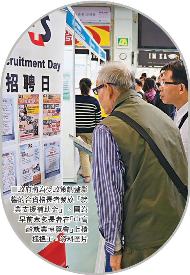
政府將為受政策調整影響的合資格長者發放「就業支援補助金」。圖為早前眾多長者在「中高齡就業博覽會」上積極搵工。資料圖片