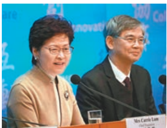
林鄭月娥昨日舉行記者會，宣佈調整多項勞工福利措施。

人士將不受新措施影響，他們毋須改領金額少約1,000元的健全成人綜援，殘疾和健康欠佳的人士亦不受影響。他並指出，現時約70%55歲至59歲的綜援受助人為殘疾或健康欠佳。