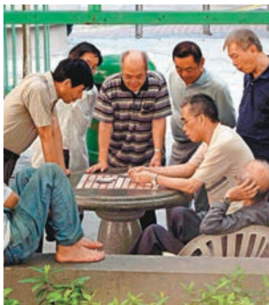
政府表示，提高申領長者綜援年齡的新措施，完全沒有節省綜援開支的考慮，而是為了配合港人長壽及人口老化的人口政策，鼓勵長者就業，延後退休年齡。資料圖片

然而，林鄭月娥指在2月1日鼓勵中老齡人士再就業的新措施推行後，60歲至64歲領取長者將被轉介到該些服務就業機構，就業支援需求增加，與整合計劃相矛盾，因此她決定推遲整合該方案。至於將來是否需要整合該計劃，則爭取在今年內作出檢討。