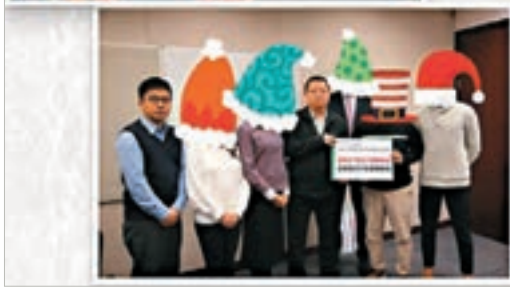
林卓廷等放上fb嘅打卡相被網民恥笑。